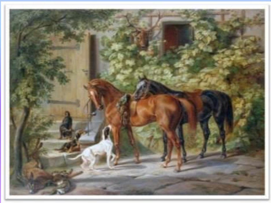
Адам Альбрехт «Лошади около крыльца»

Картина написана немецким Художником в 1843г.