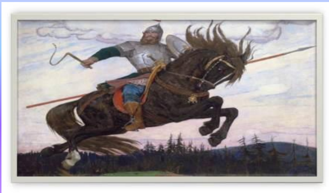
Виктор Васнецов « Богатырский галоп» 1914 г.