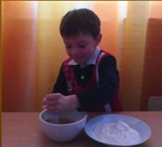
Мелим зерно в ступе