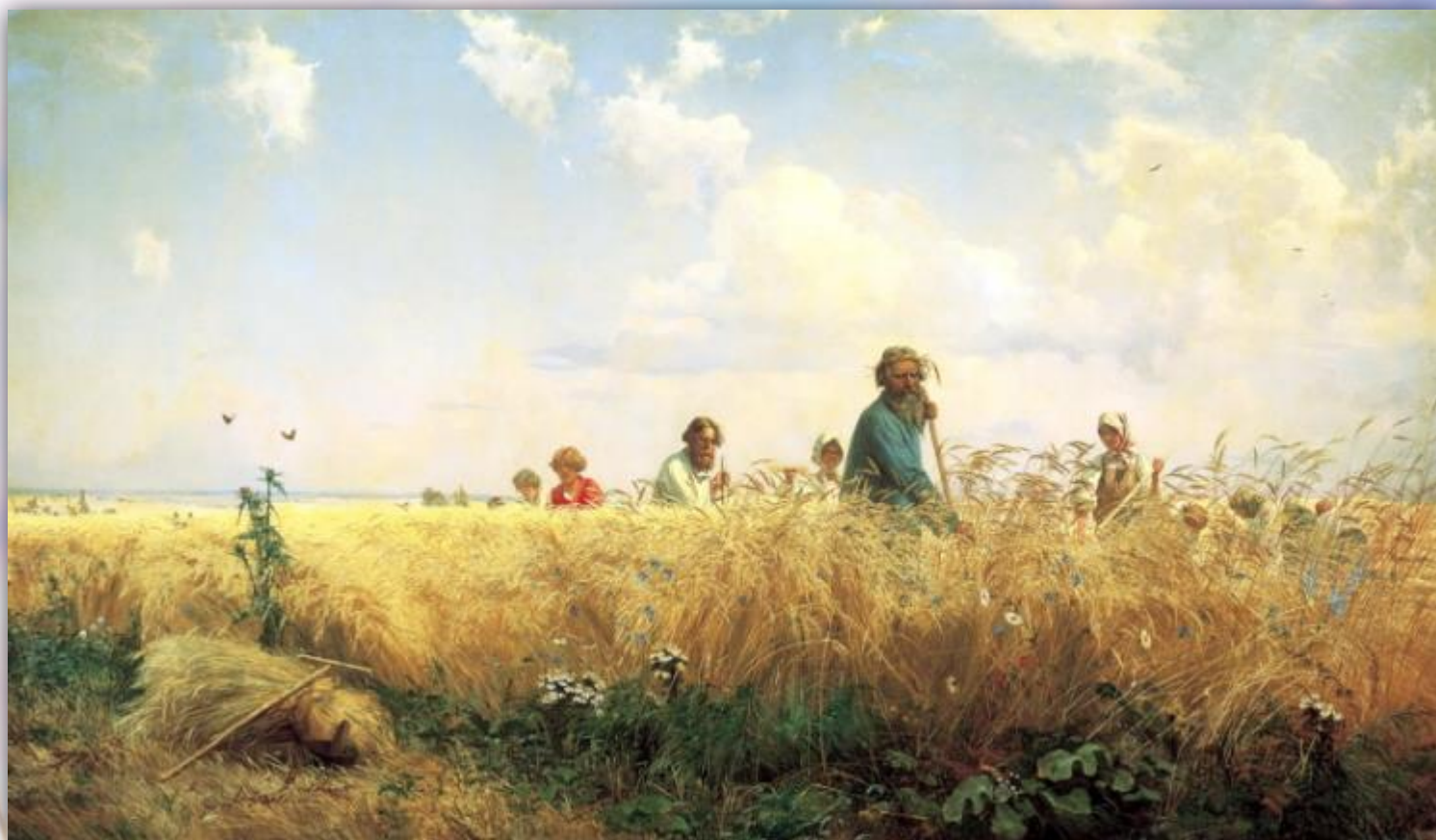
Т. Мясоедов «Страдная пора»