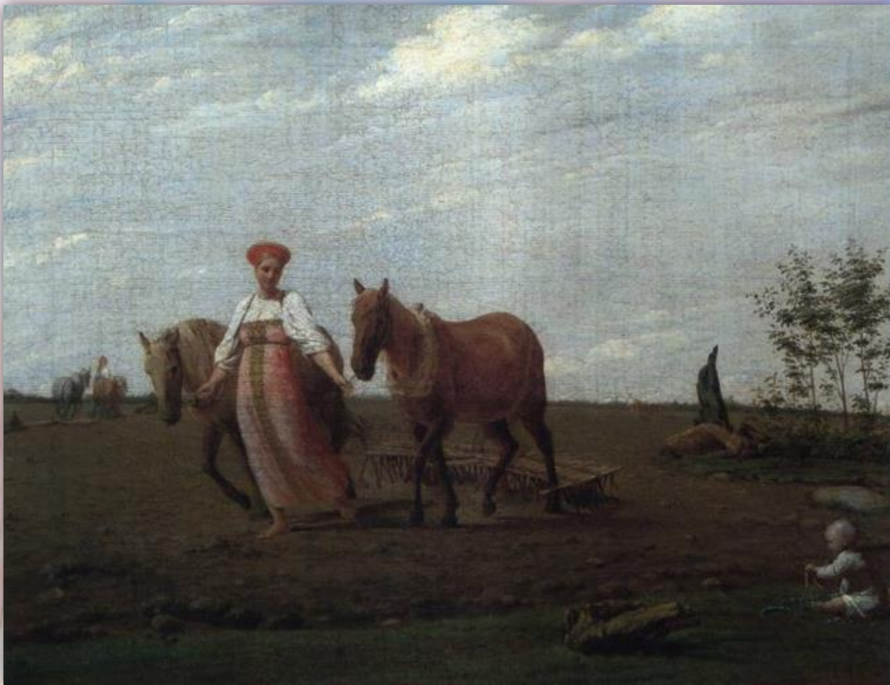
А. Венецианов "На пашне. Весна"