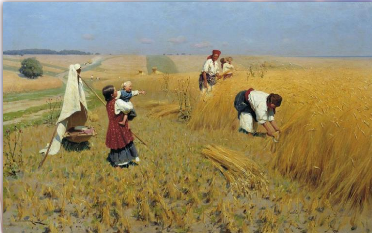
Т.Мясоедов "Страдная жатва"