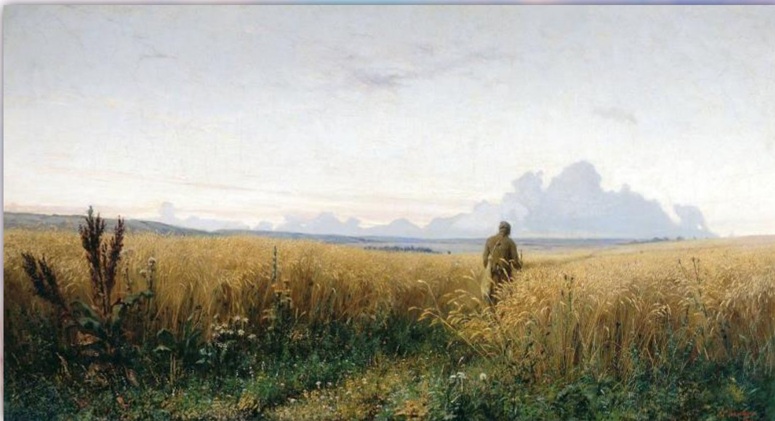
Т.Мясоедов "Дорога во ржи"