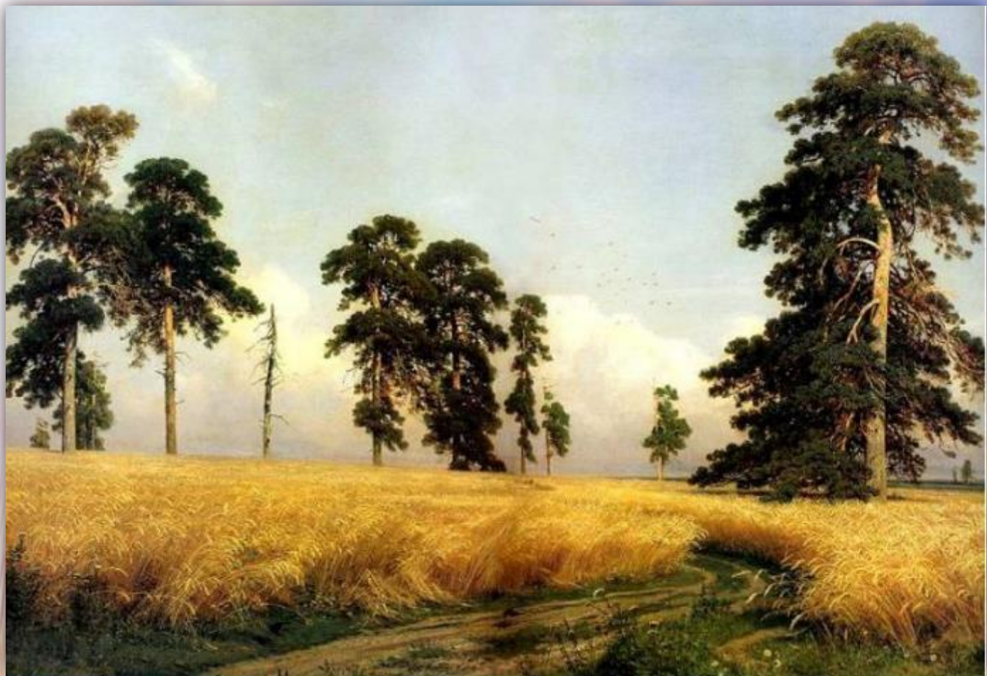
И. Шишкин "Рожь"