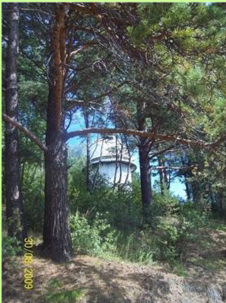
Солнечная обсерватория в Листвянке