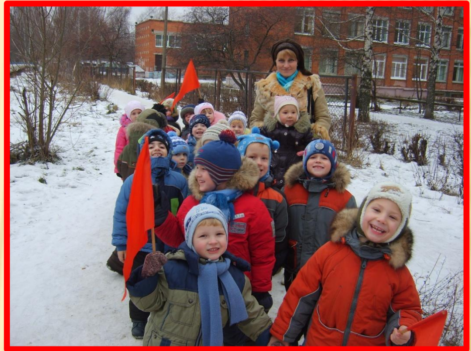
Прогулка «По улицам Нижнего»