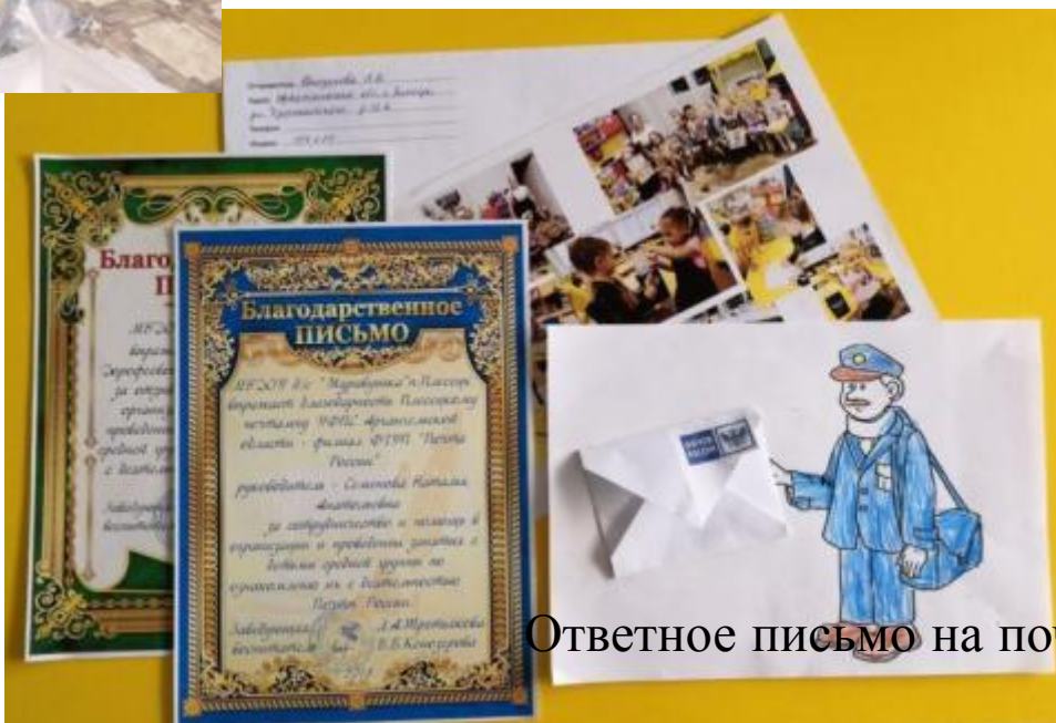
Ответное письмо на почту