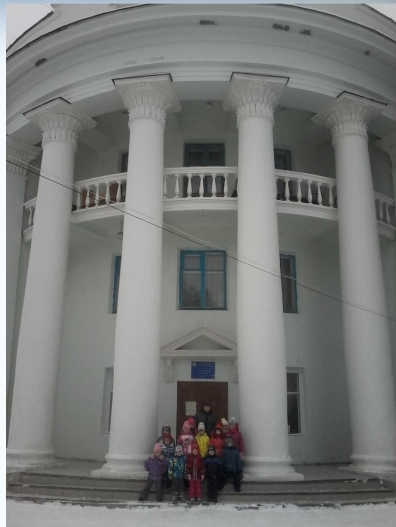
Символ Жигулёвска: здание школы искусств