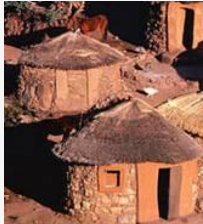
Каменные дома в Африке