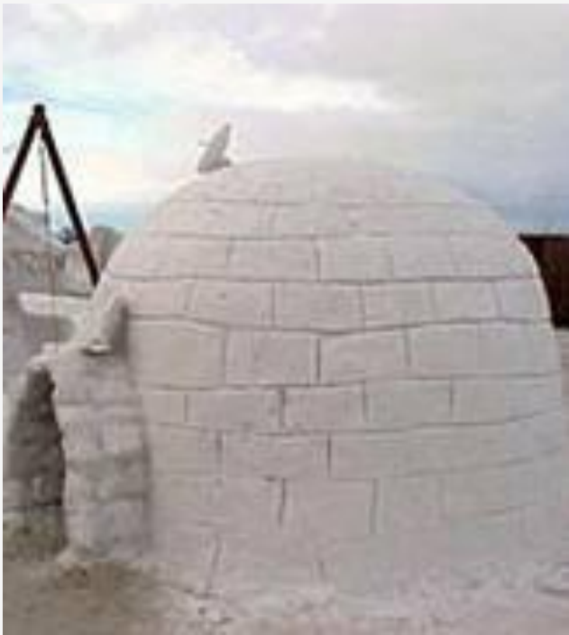
Иглу- снежный дом