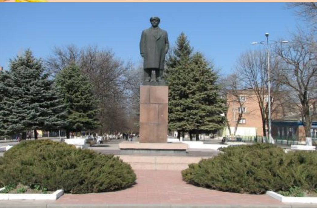
Памятник В.И. Ленину