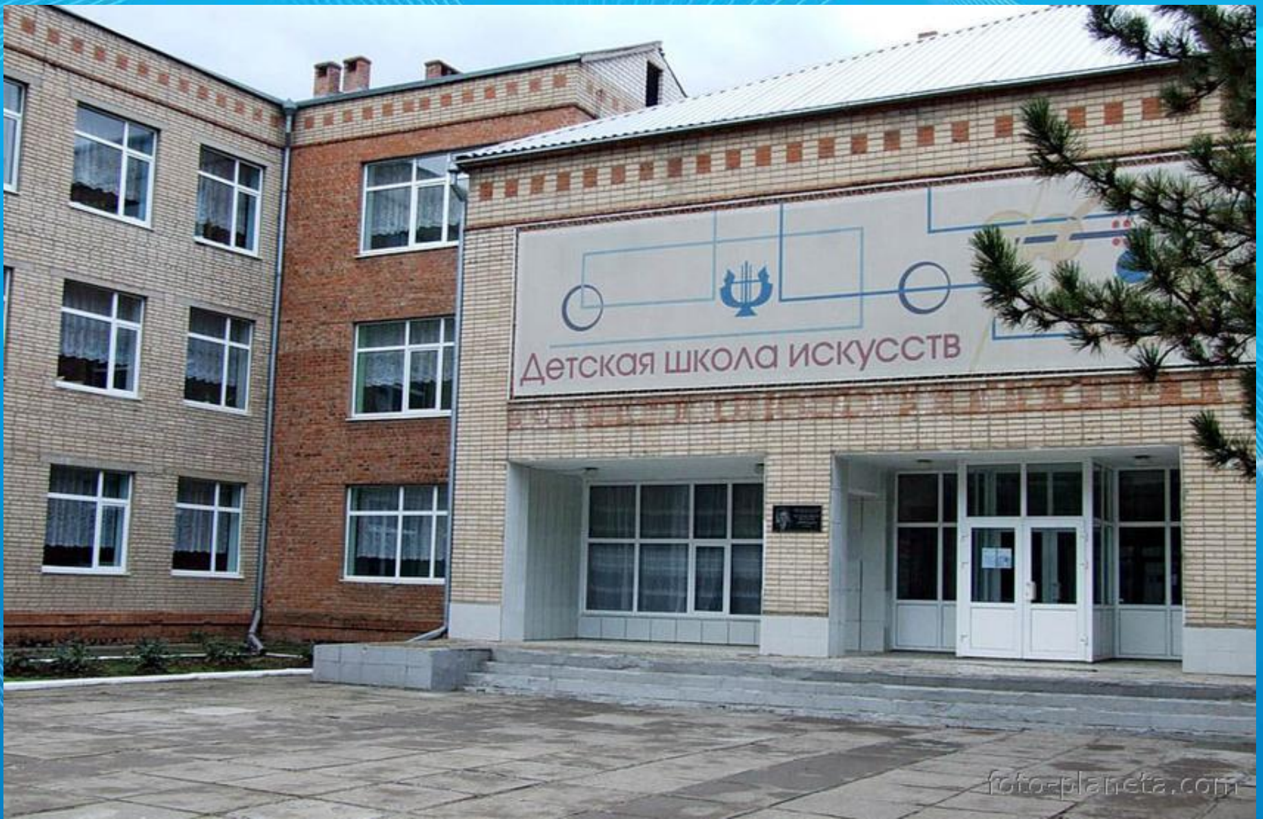
Музыкальная школа им. В.Н. Еджика