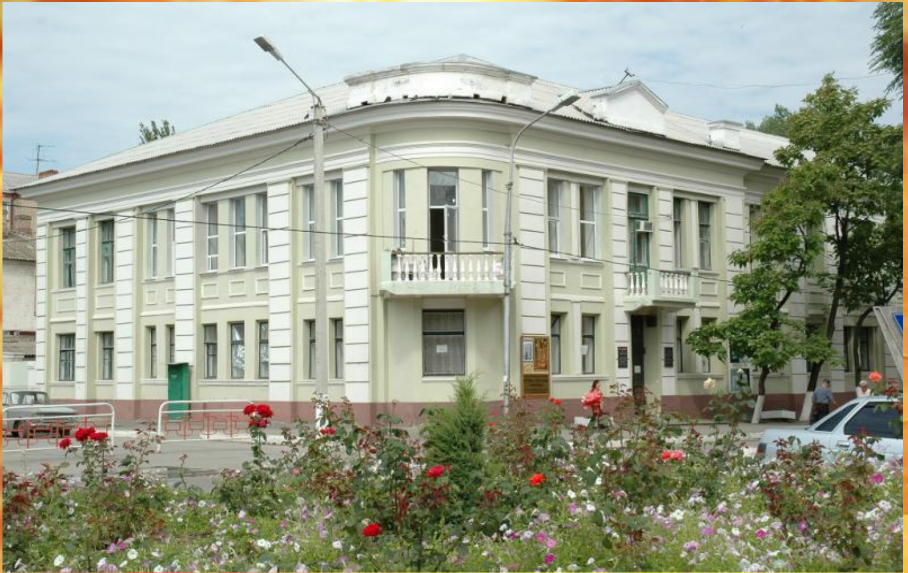
Картинная галерея им. В.К. Нечитайло