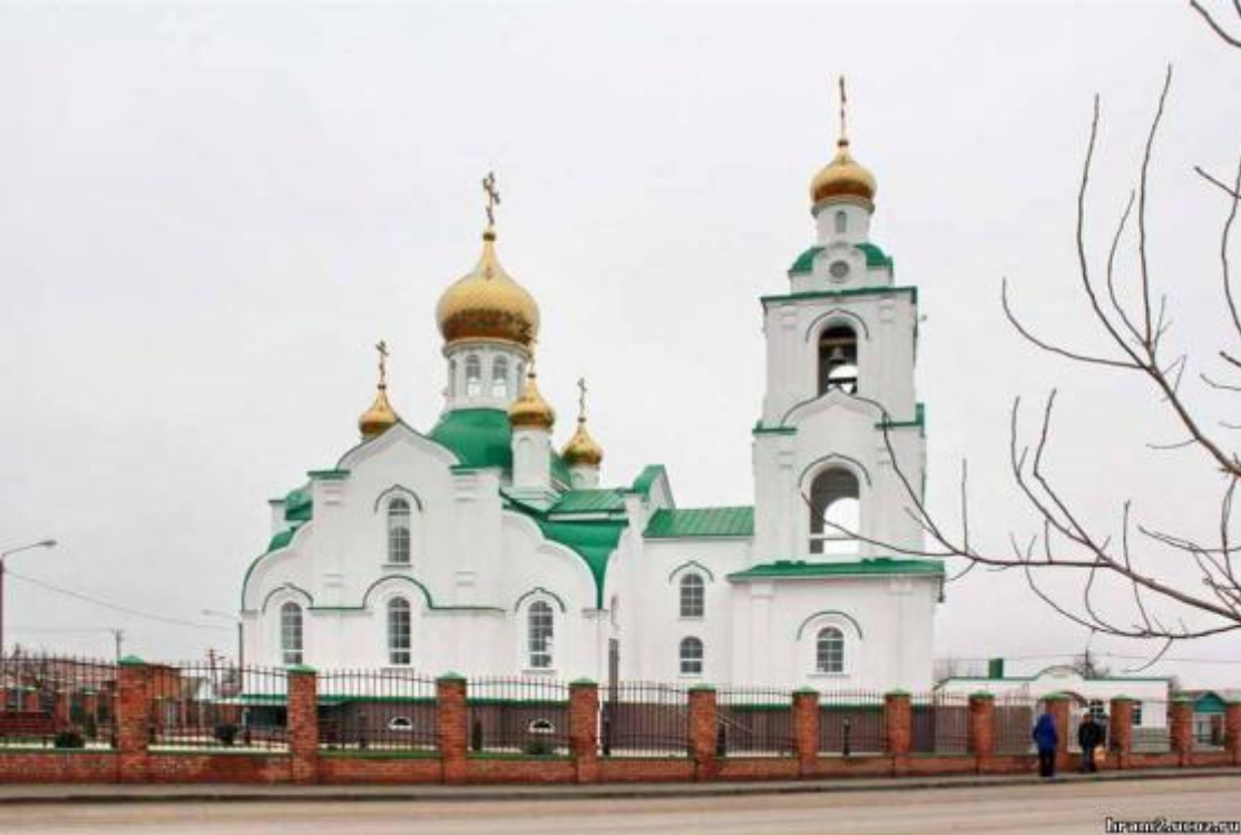
Храм Дмитрия Ростовского