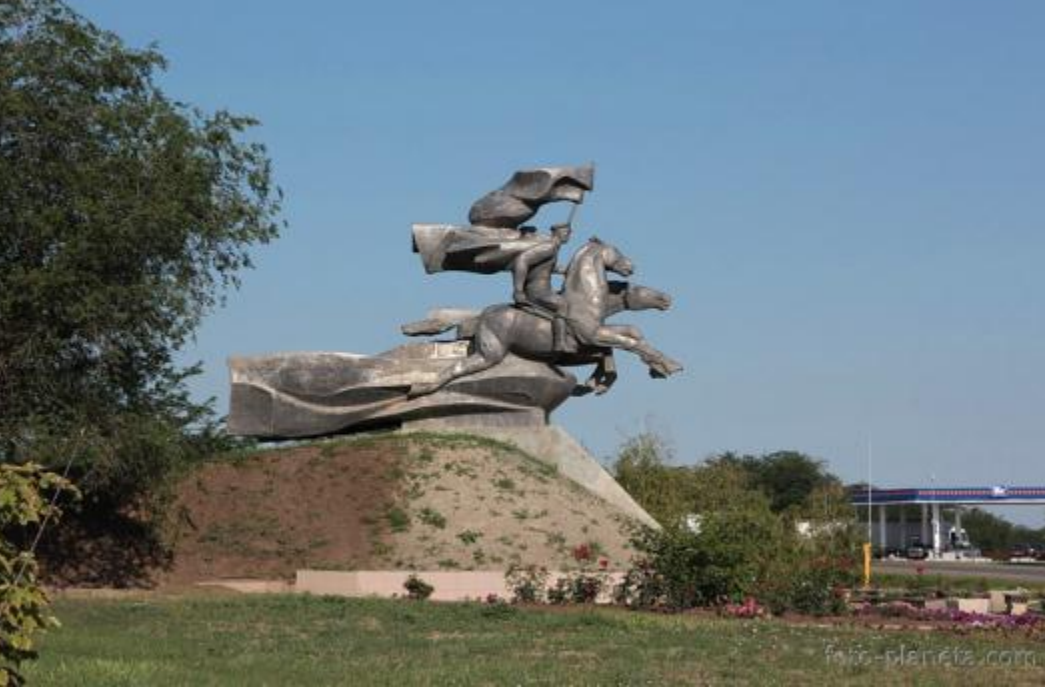
Памятник 116-й Донской кавалерийской дивизии