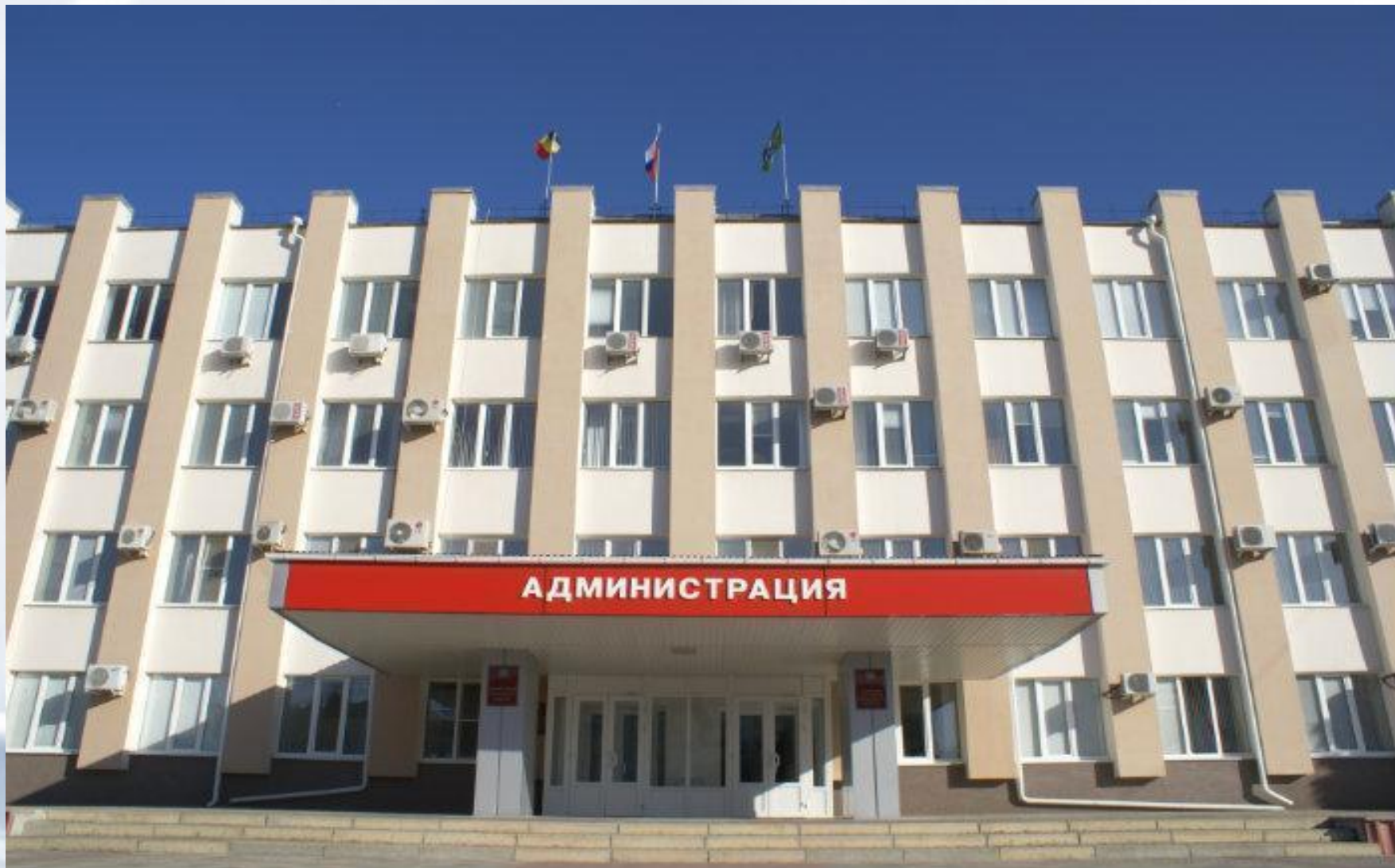
Администрация Сальского района.