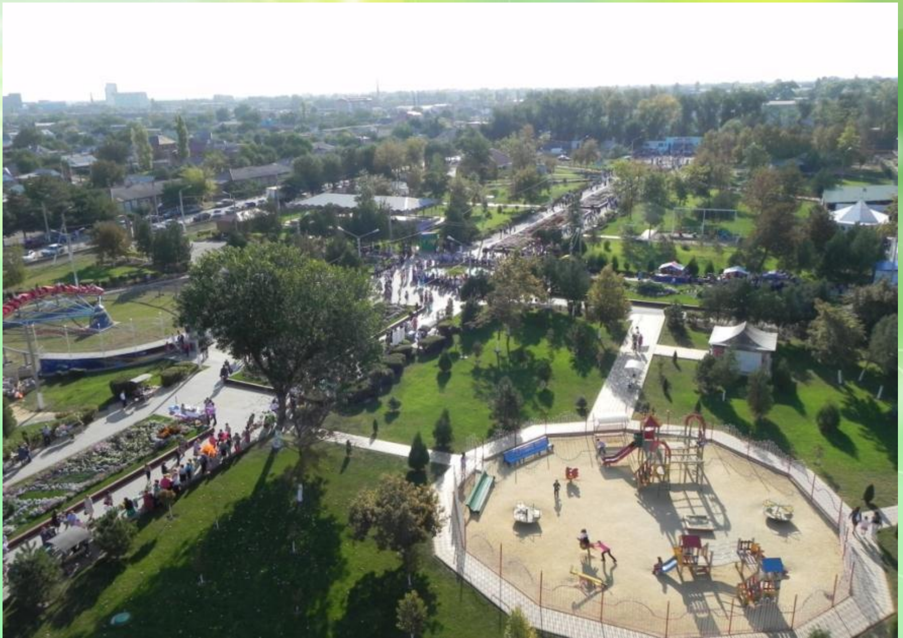
Парк культуры и отдыха