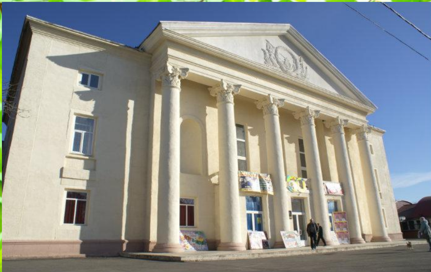
Дом культуры им. Р.В. Негребецкого