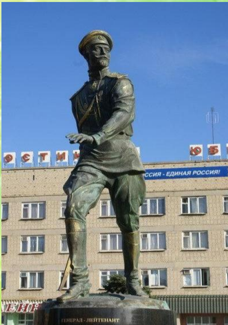
Памятник генералу С.Л. Маркову