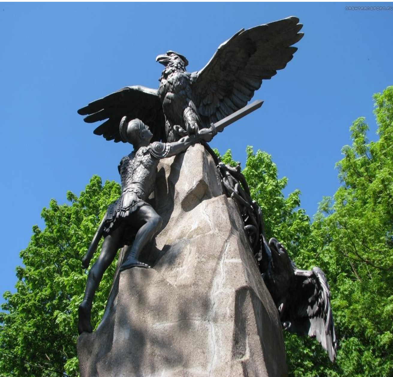
Памятник «Благодатная Россия»