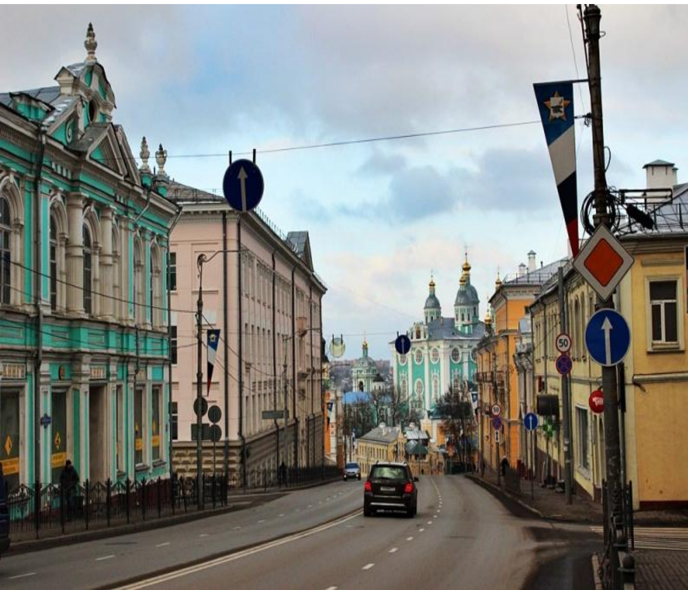
Улица Большая Советская