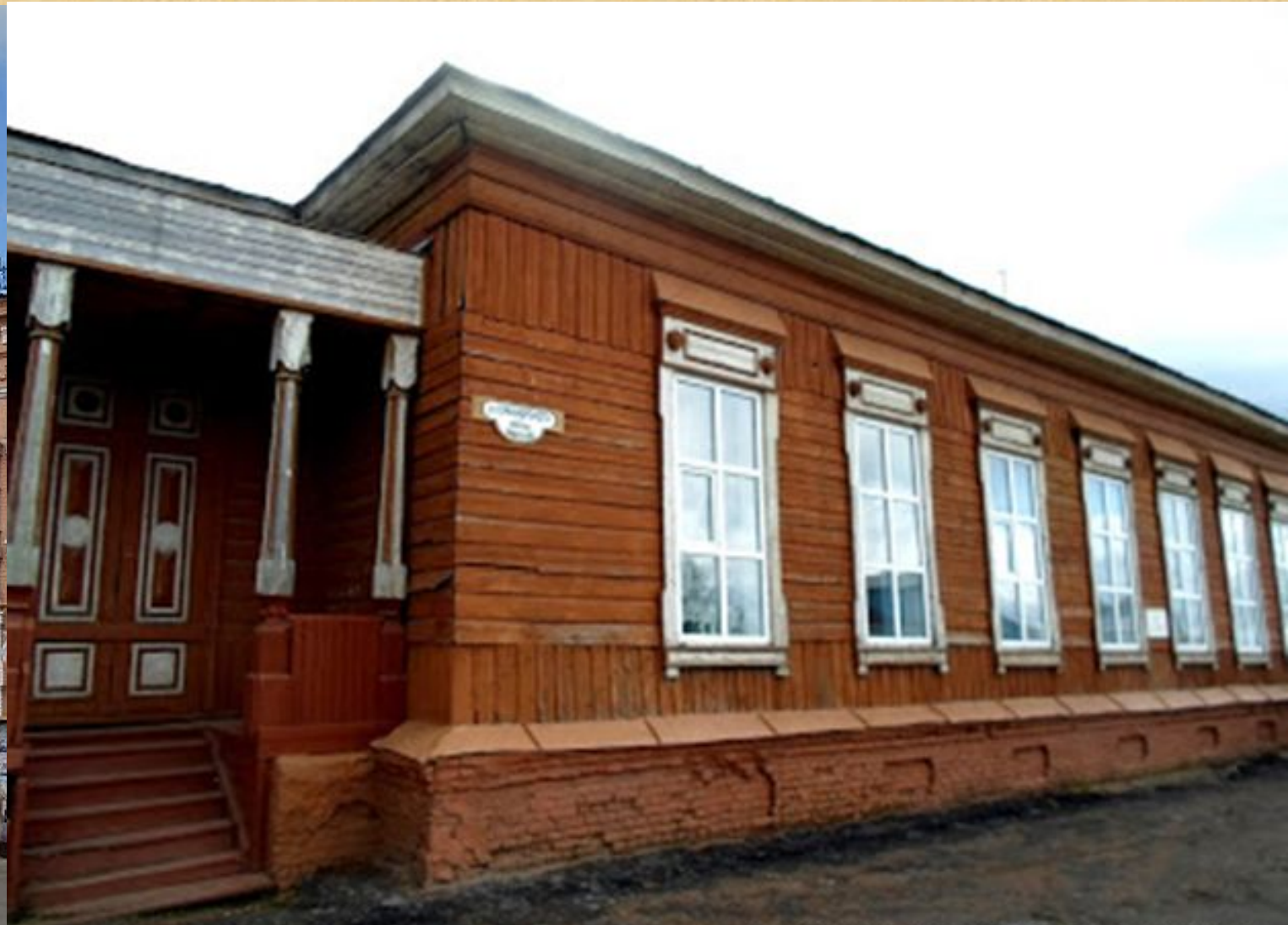
КРАЕВЕДЧЕСКИЙ МУЗЕЙ (НАРОДНЫЙ ДОМ)