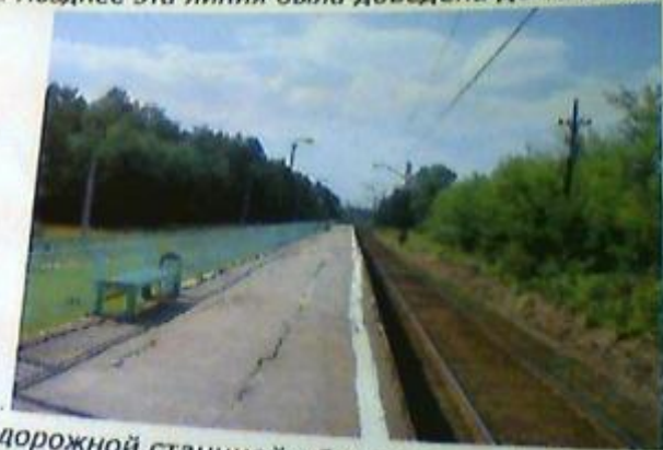
Рядом с железнодорожной станцией образовался посёлок станции

Большие изменения произошли в Хлюпино в период гражданской войны. В январе 1920 года в Москве сложилось критическое положение с топливом. Для заготовки дров была проложена дорога от Голицына до Хлюпино. Этот пункт был открыт в 1926 году и получил название по расположенной в деревне Хлюпино. Позднее эта линия была доведена до Звенигорода.