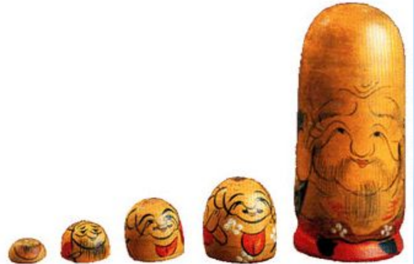
Разъёмные точёные фигурки Фукурума.