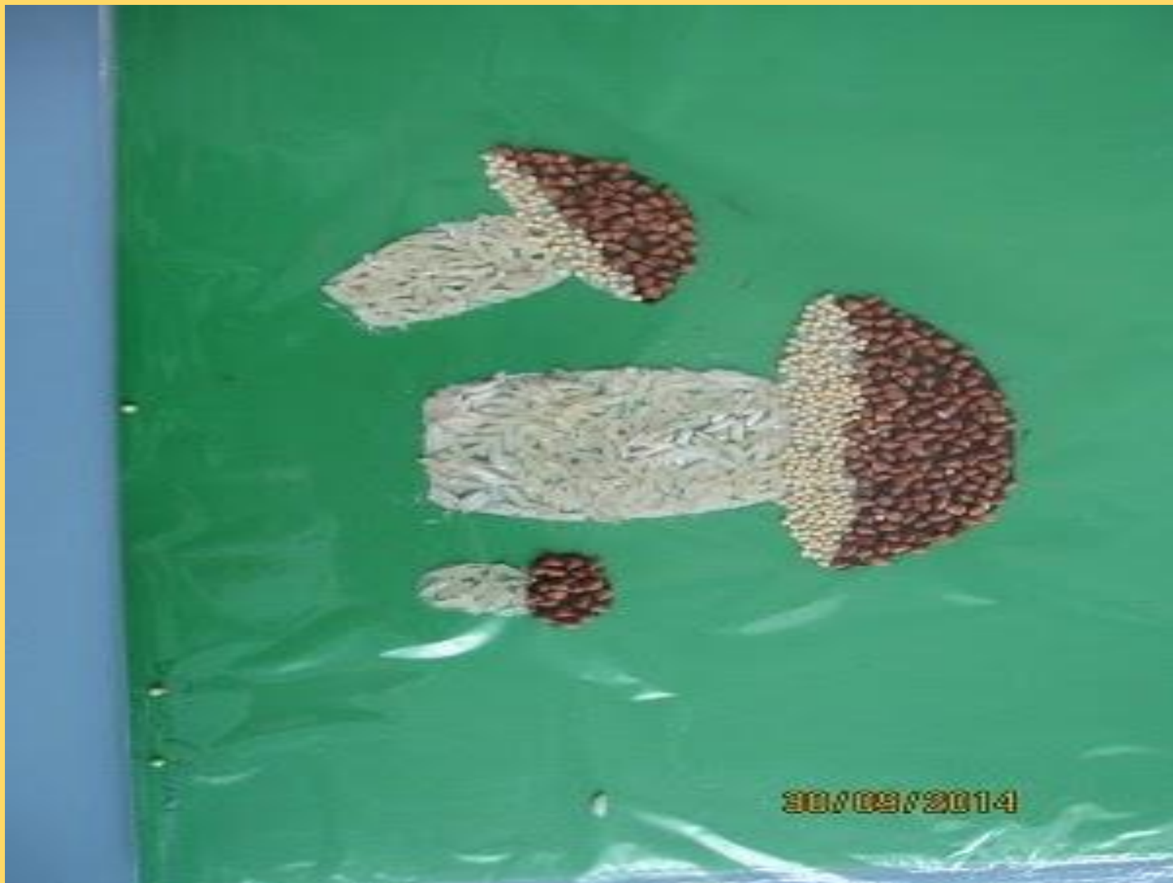
Подделка семьи Димы Тишкова.