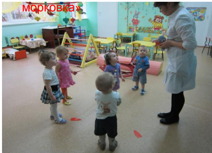
Подвижная игра «Зайка и морковка»