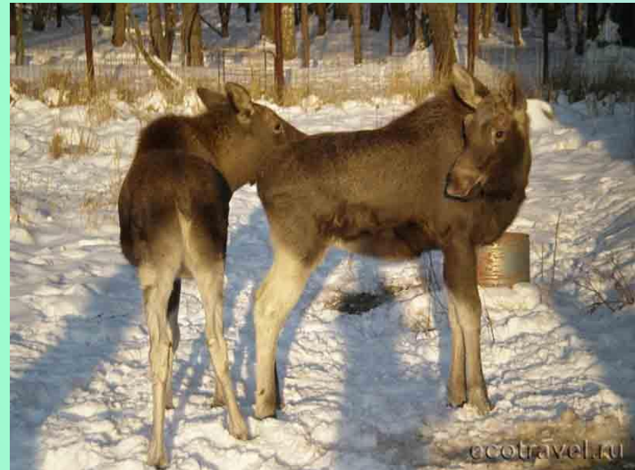
лосиха с лосенком