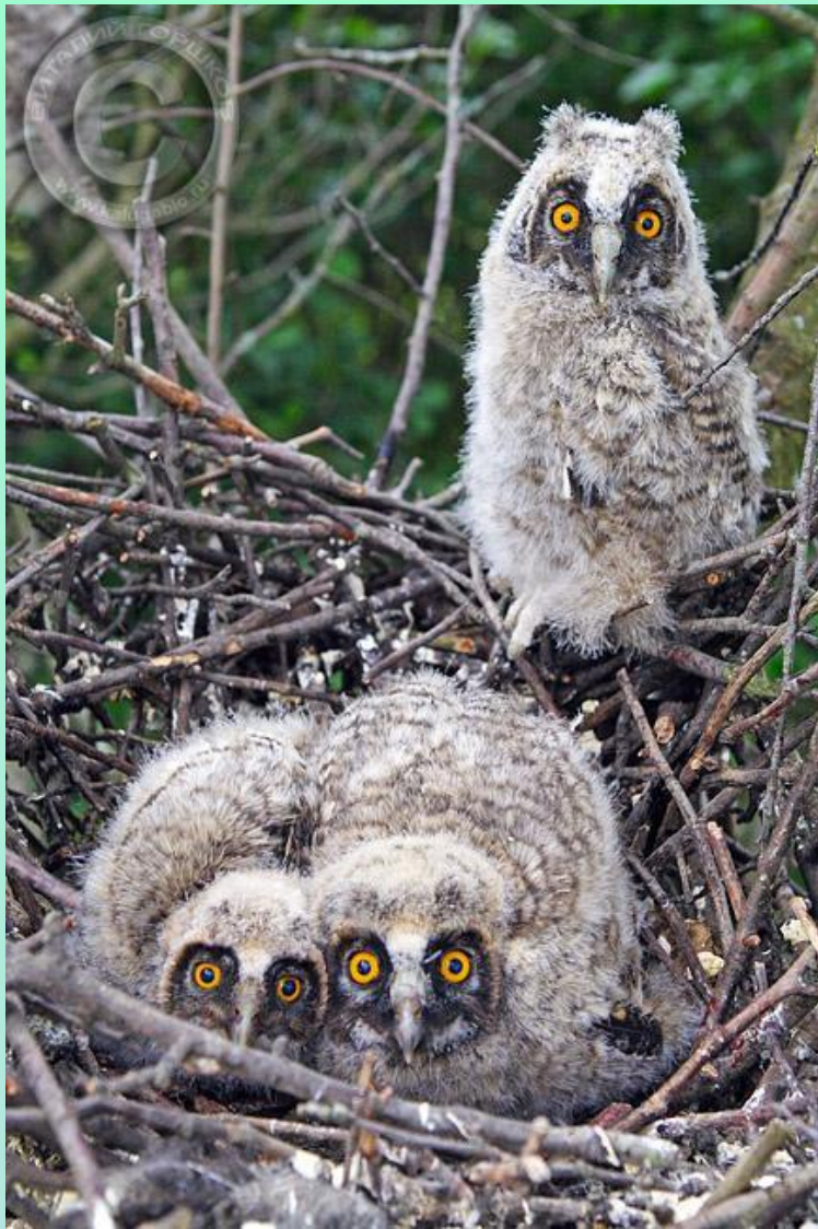
птенец ушастой совы