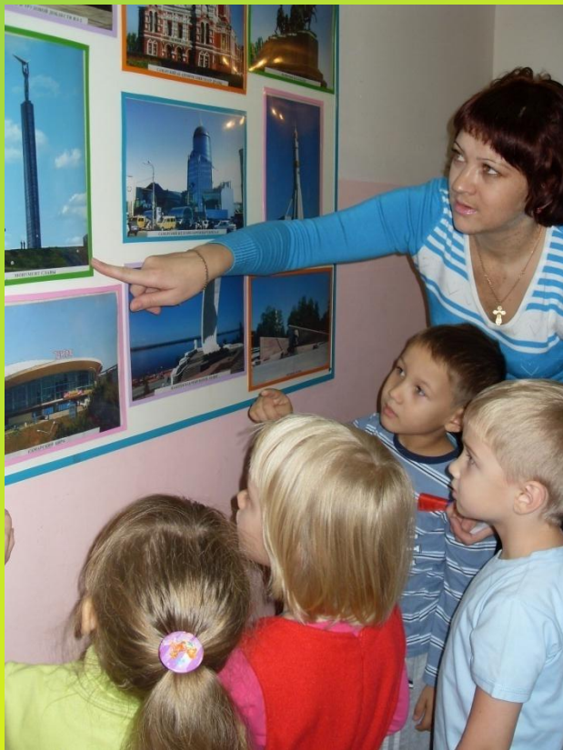
Знакомство с достопримечатель- ностями города