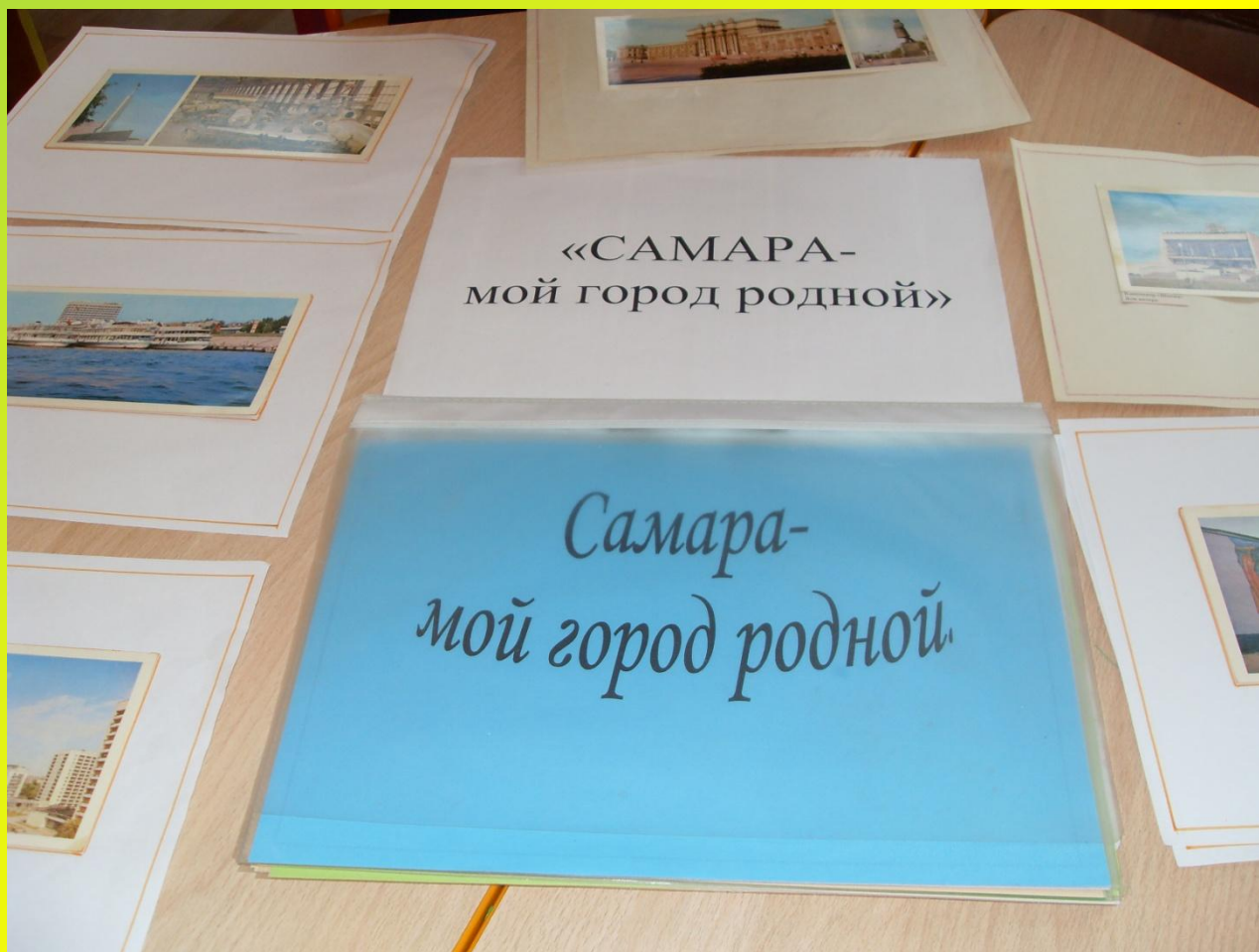
Создание альбома «Самара - мой город родной»