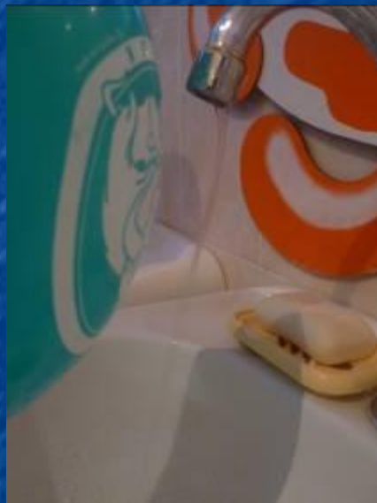
Шарик притягивает струйку воды