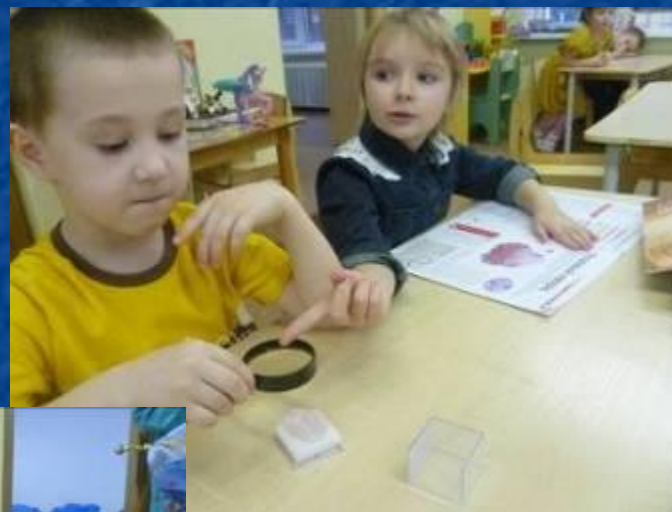
Дети учатся классифицировать камни по форме, цвету, размеру, особенностям поверхности (гладкие, шероховатые)