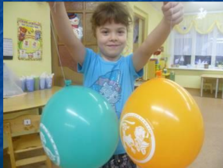
Слева шарики отталкиваются (они заряжены одноименно), справа - притягиваются (заряжены разноименно)