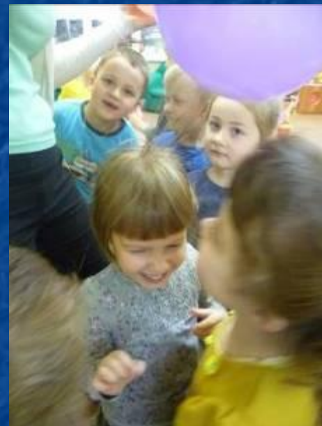
Шарик притягивает волосы