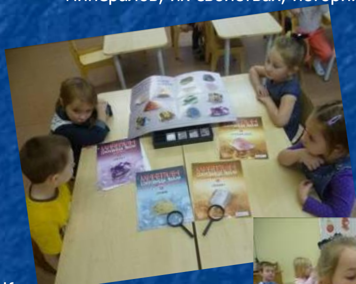
Коллекция еженедельно пополняется

К каждому камню есть журнал, в котором интереснейшие рубрики классификации минералов, их свойствах, истории их открытия и изучения, химических способностях.