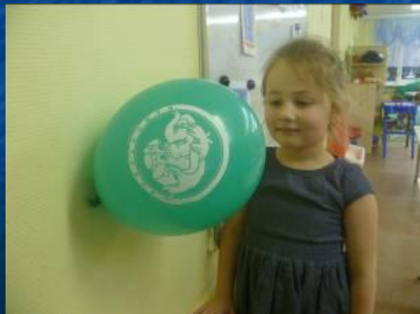
Наэлектризованный шарик прилипает к стене