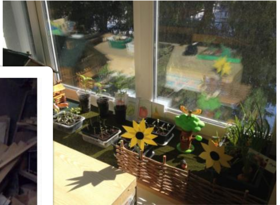
Огород на подоконнике