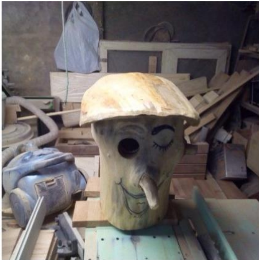
Изготовление скворечников родителями