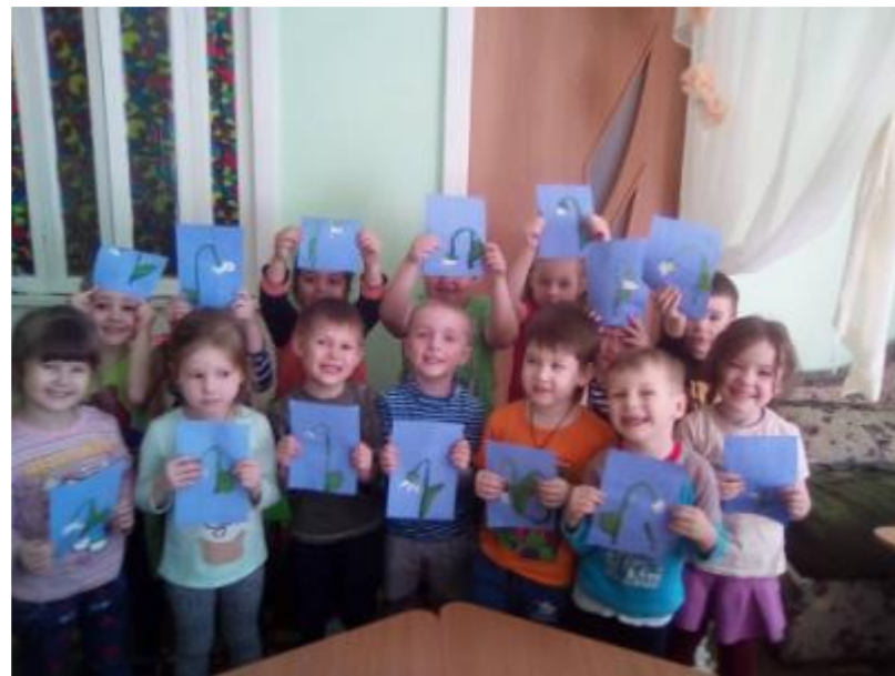
Наблюдение за проталинами, первоцветами