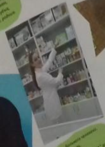
Для здоровья человека, Нужно так любить, Нужно так любить, Нужно так любить.