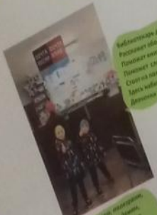
Библиотекарь добрый друг, Помогай всем нам, Помогай всем нам, Помогай всем нам, Стой на своем, Ты ведь помогаешь, Детям и родителям.