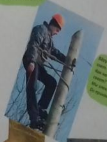
Вот так и работать надо, Вот так и работать, Вот так и работать.