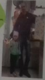
Библиотекарь добрый друг, Помогай всем нам, Помогай всем нам, Помогай всем нам.