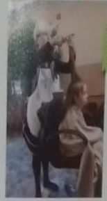
Делать вам надо работу, Он вам скажет правильно, Помогайте вовремя, Поддержите нас, счастливыми.