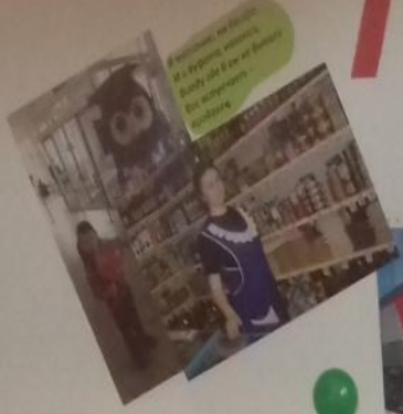
В аптеке вы можете найти лекарства, А также купить продукты.