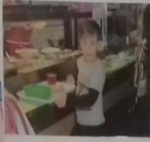
Знает Авария секрет, Приготовленная еда Вкусна (скажем им за это, Быть повара - великий труд!