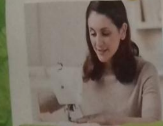
Сшить платье и юбку можно, Если у тебя талант, И если у тебя талант, И если у тебя талант.