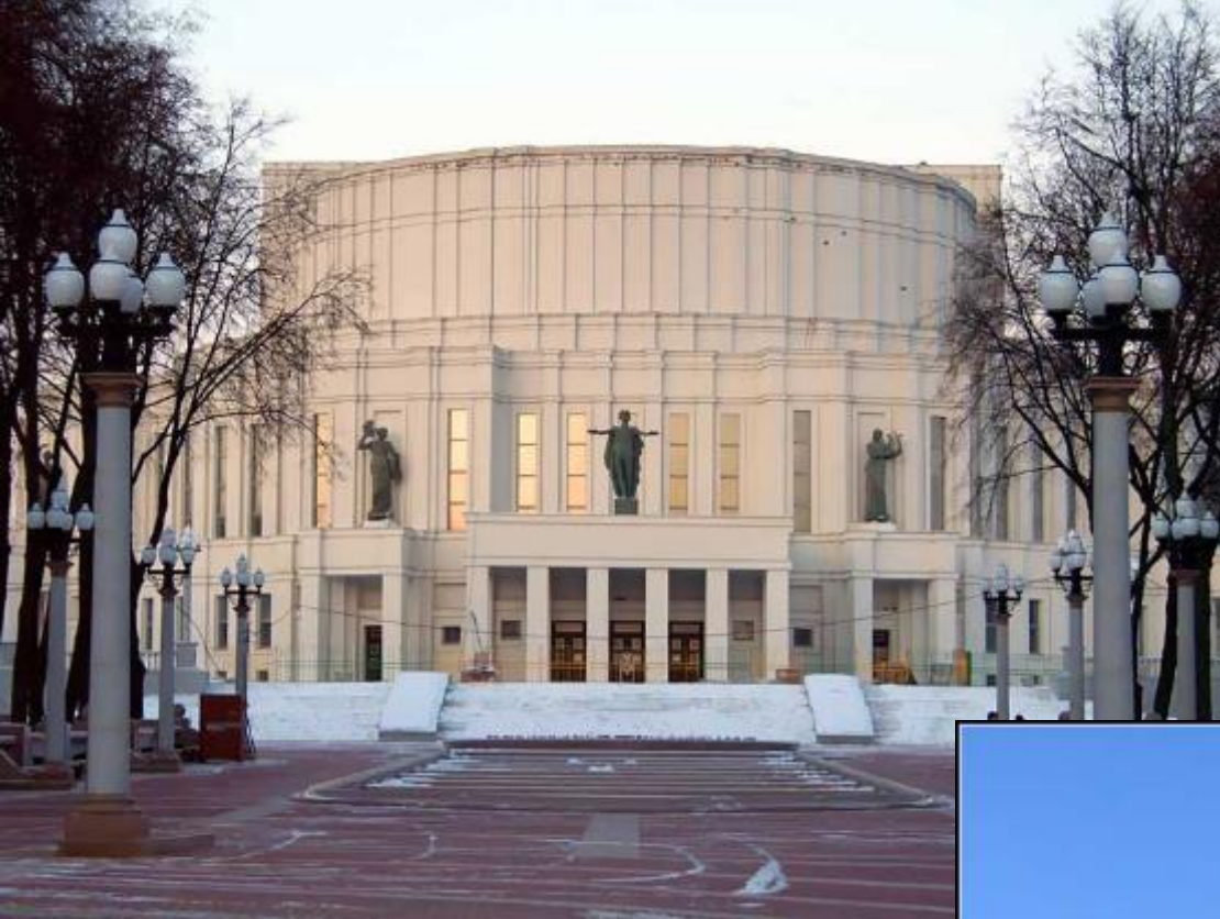
Здание театра оперы и балета.