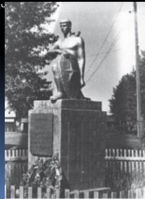
Памятник павшим в Троицке