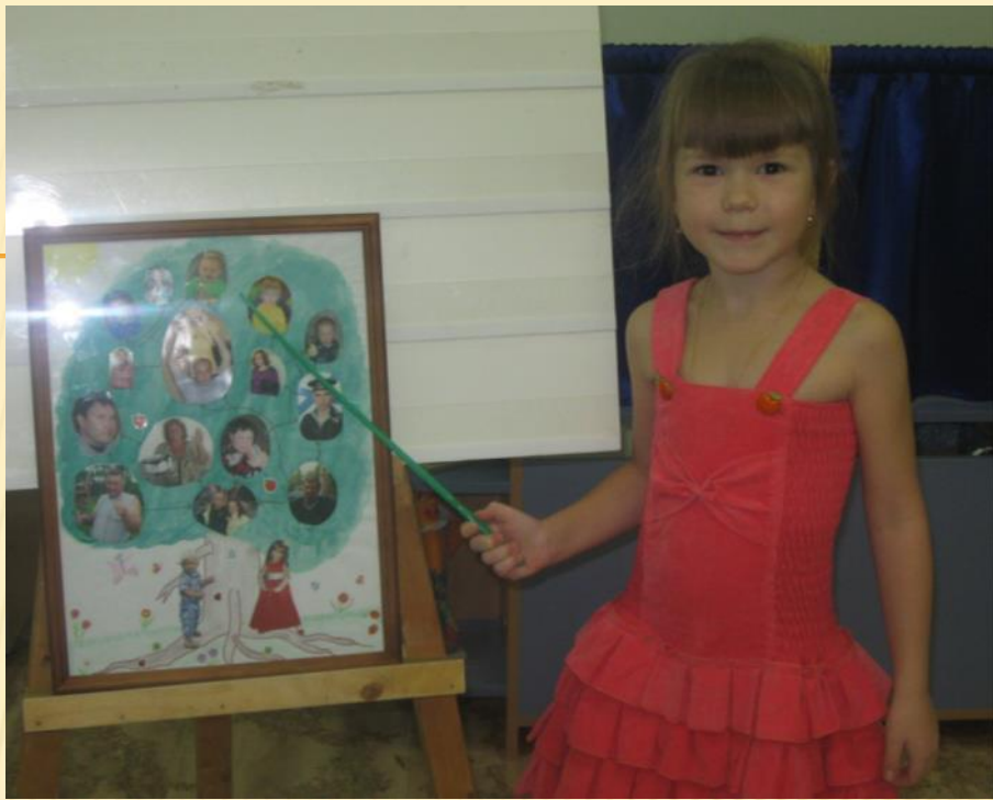
Семья Алёны М..