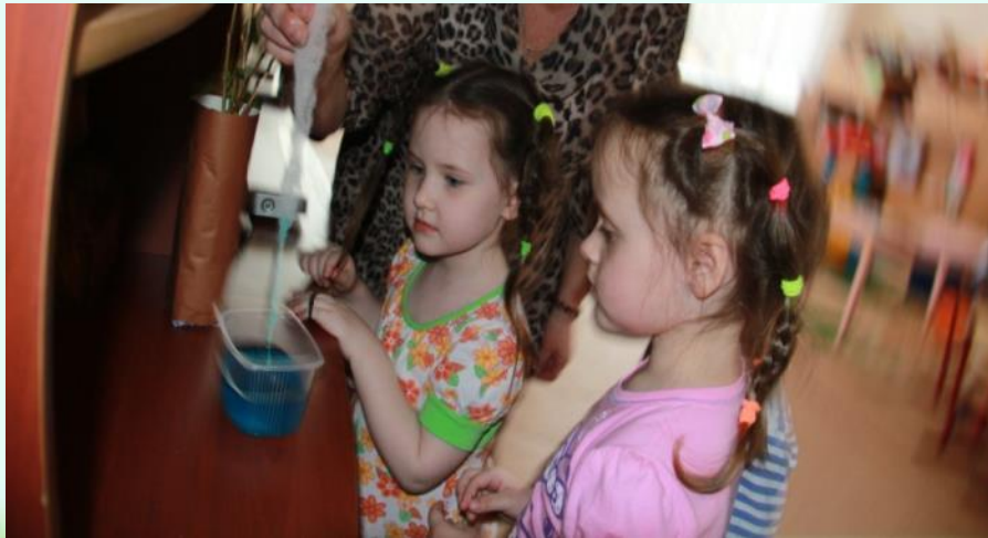
Растения пьют воду