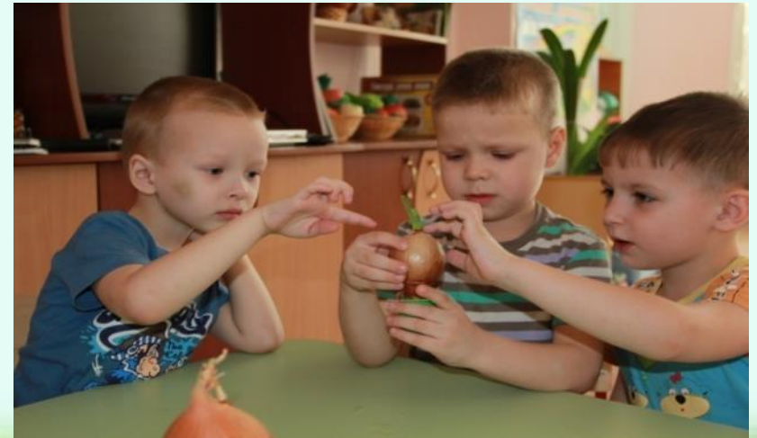
Растения любят тепло и свет.