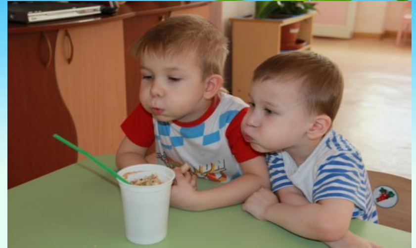
Корень крепко удерживает растение