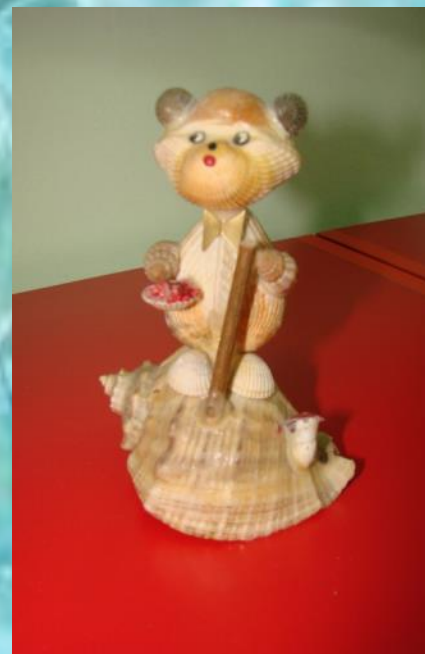
«Медведь» Л. Саша