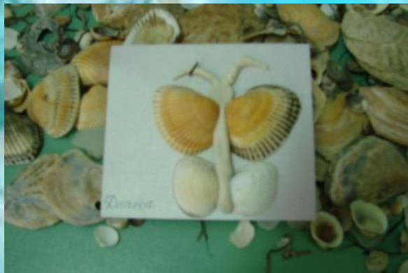
«Бабочка» А. Диана