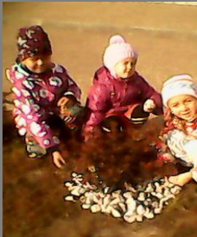
Клумба из камней