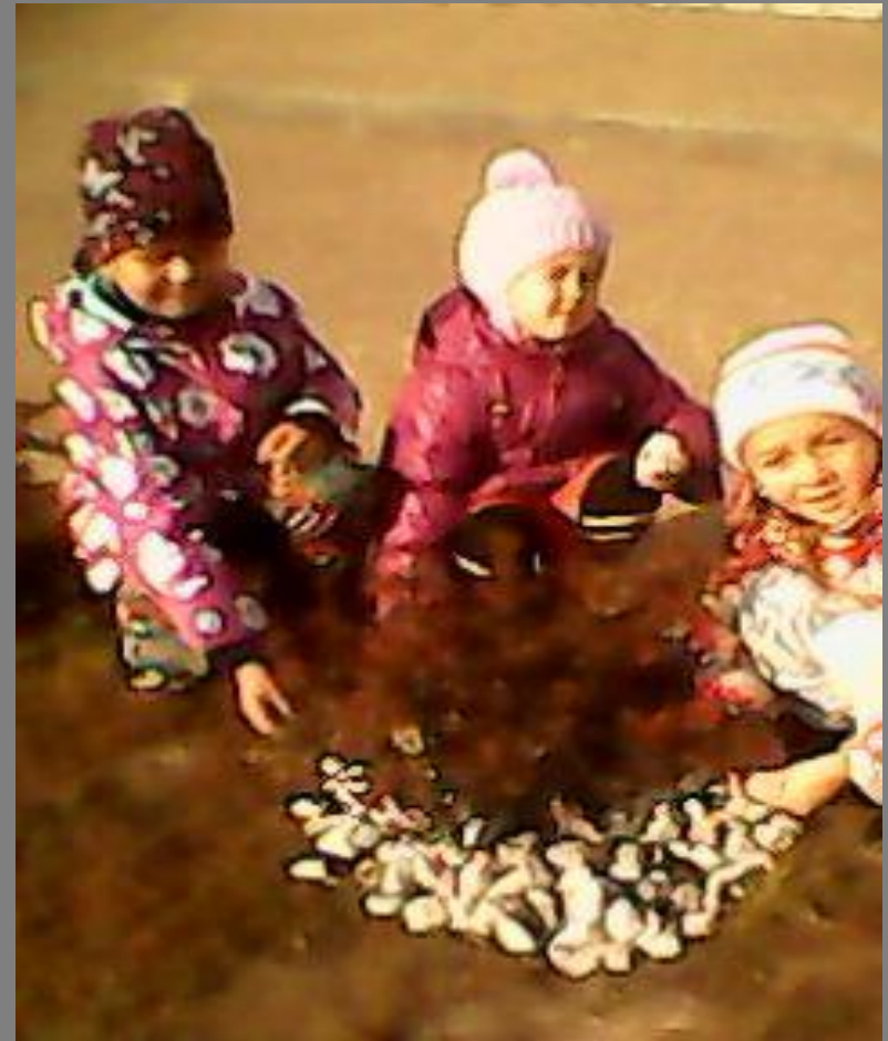
Клумба из камней