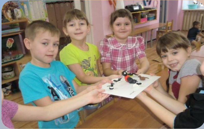
Лепка «Зимующие птицы»