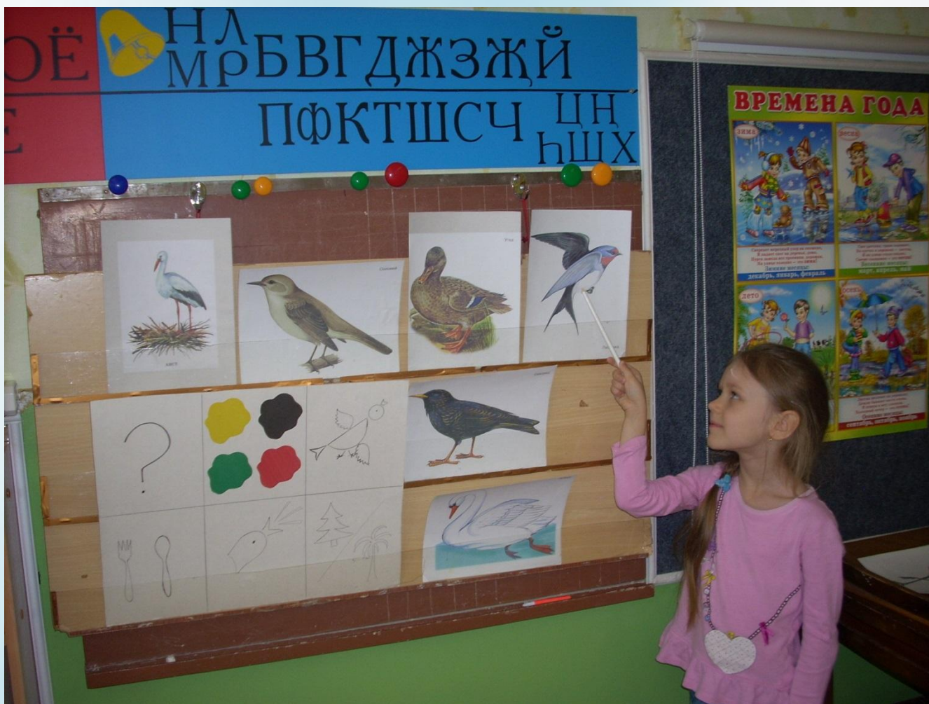
Ди «Четвертый лишний» (перелетные и зимующие птицы)