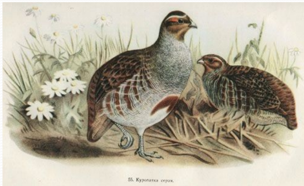
55. Куропатка серая.