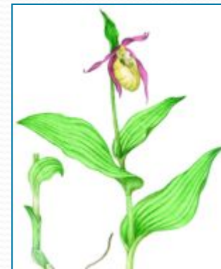
5 венерин башмачок

Орхидея - одно из самых красивых растений, которые растут на опушках, полянах, в зарослях кустарников. Его средний лепесток имеет форму туфельки .