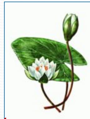
4 кувшинка белая