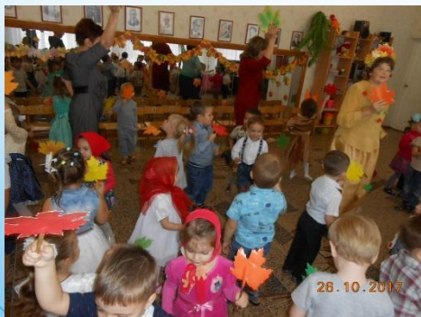
Праздник Осени. Выставка в группе. Д\и «Времена года». Аппликация «Осеннее солнышко»