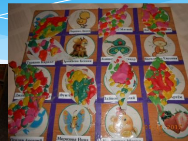
Лепка « Осеннего Листочка»