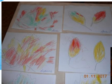
Рисование »Раскрась ЛИСТОК»