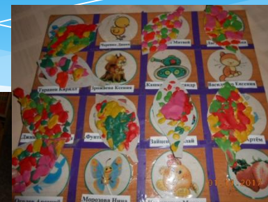
Лепка « Осеннего Листочка»