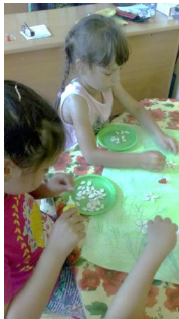
Коллективная работа «Ромашки»