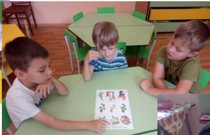
Игра «Что сначала, что потом»