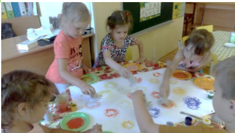
Коллективная работа «Луговые цветы»