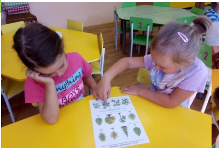
Игра «Четвертый лишний»