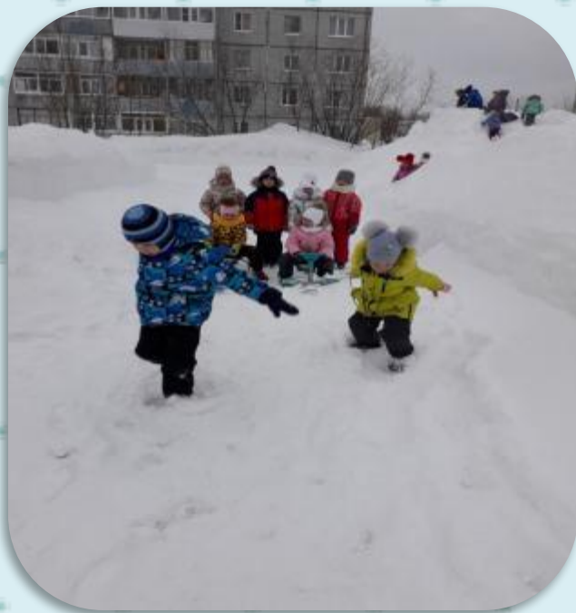
Катание на санках