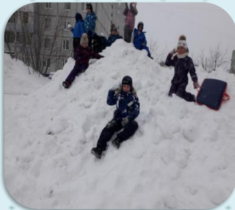
Игра в снежки