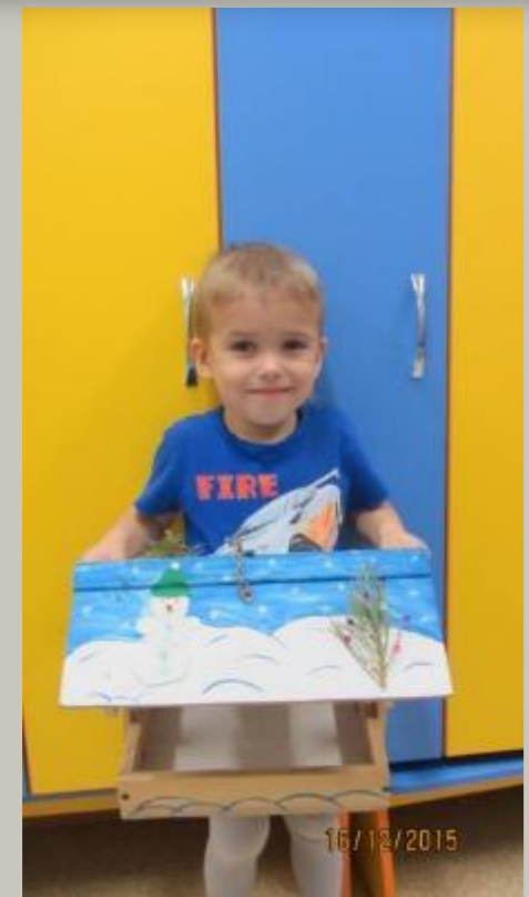
Наши первые кормушки