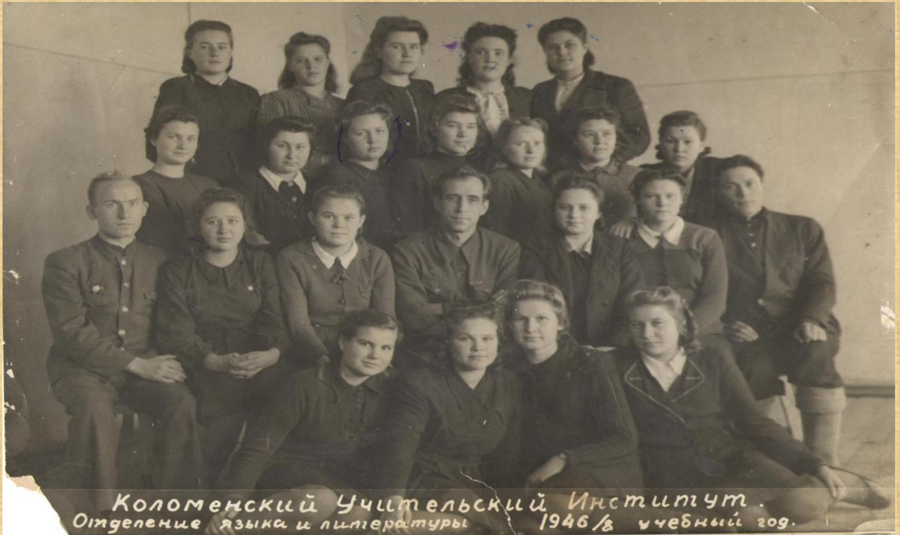
Коломенский Учительский Институт. Отделение языка и литературы 1946/8 учебный год.