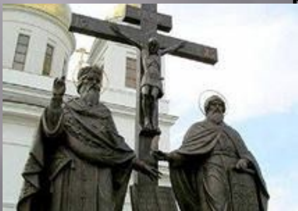
Памятник Кириллу и Мифодию