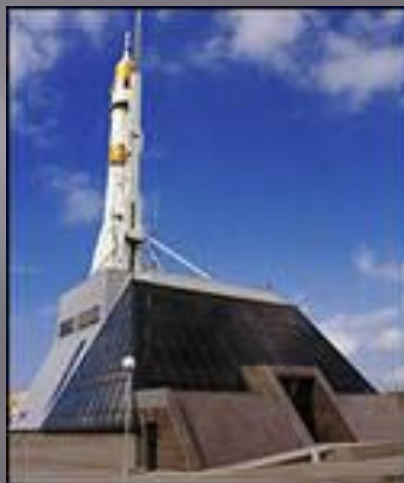
Музей «Самара космическая»