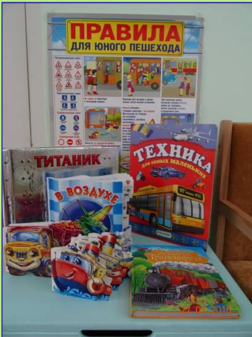
Оформление предметно-пространственной среды по теме «Транспорт»