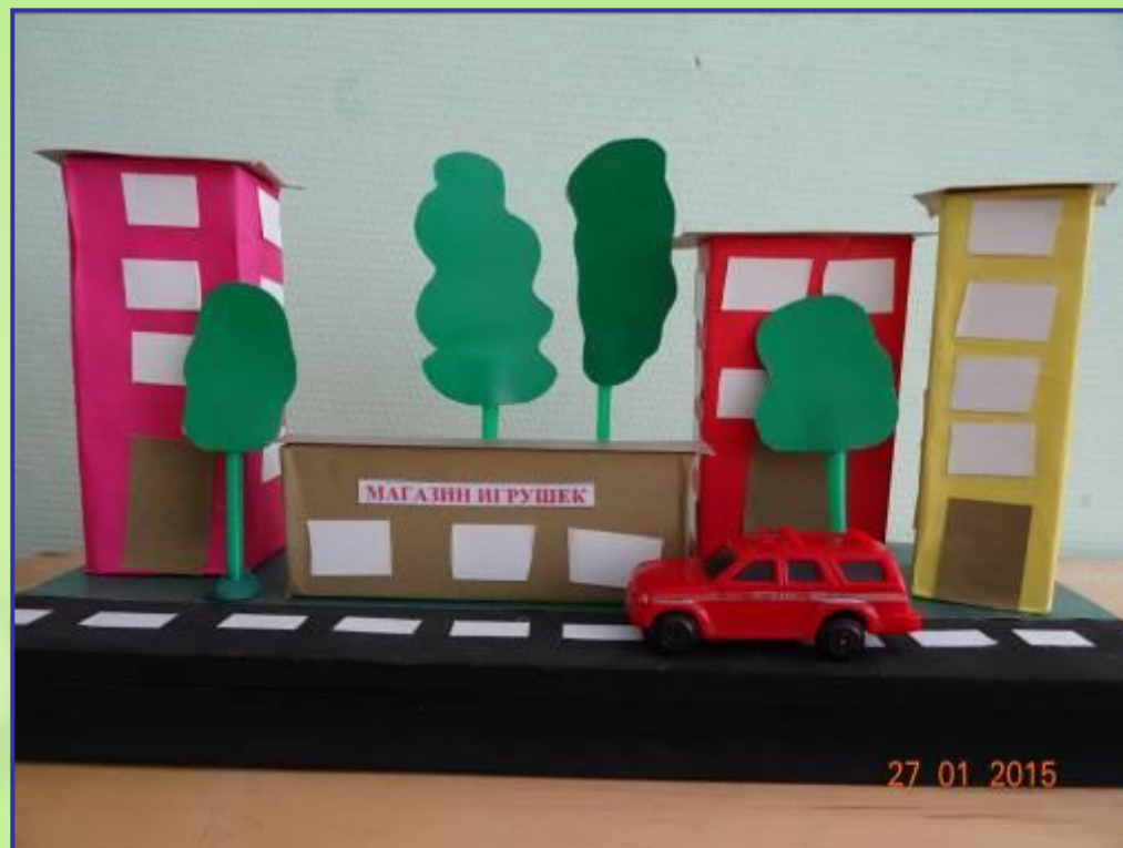
Ручной труд. Макет улицы.