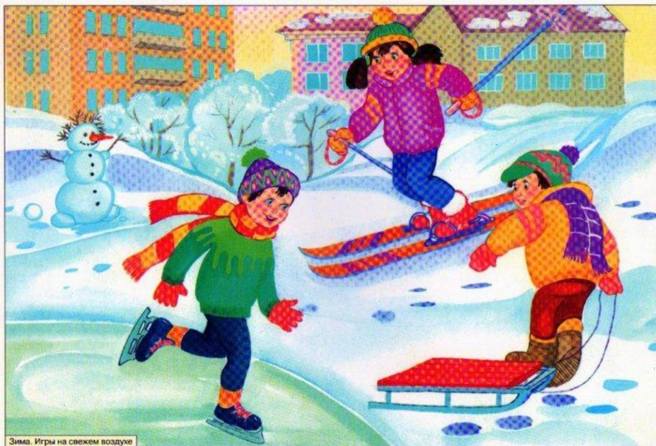
Зима. Игры на свежем воздухе