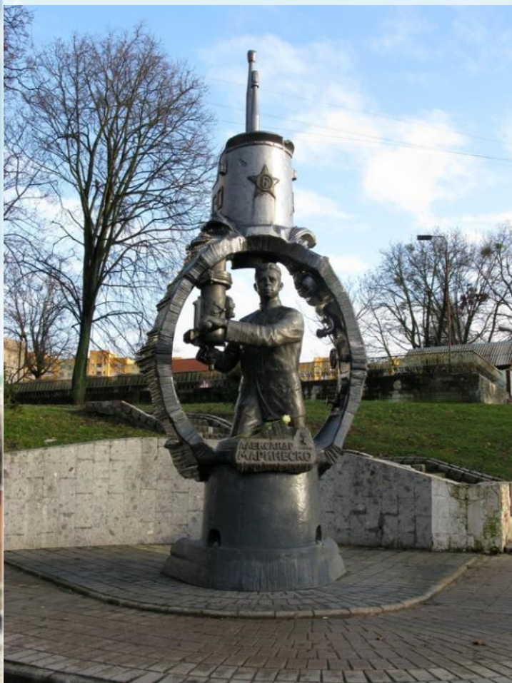
Памятник герою Александр Маринеско, командиру подводной лодки