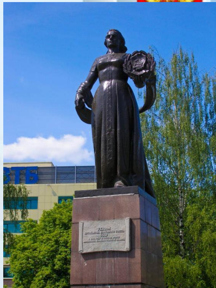
Монумент «Мать Россия»