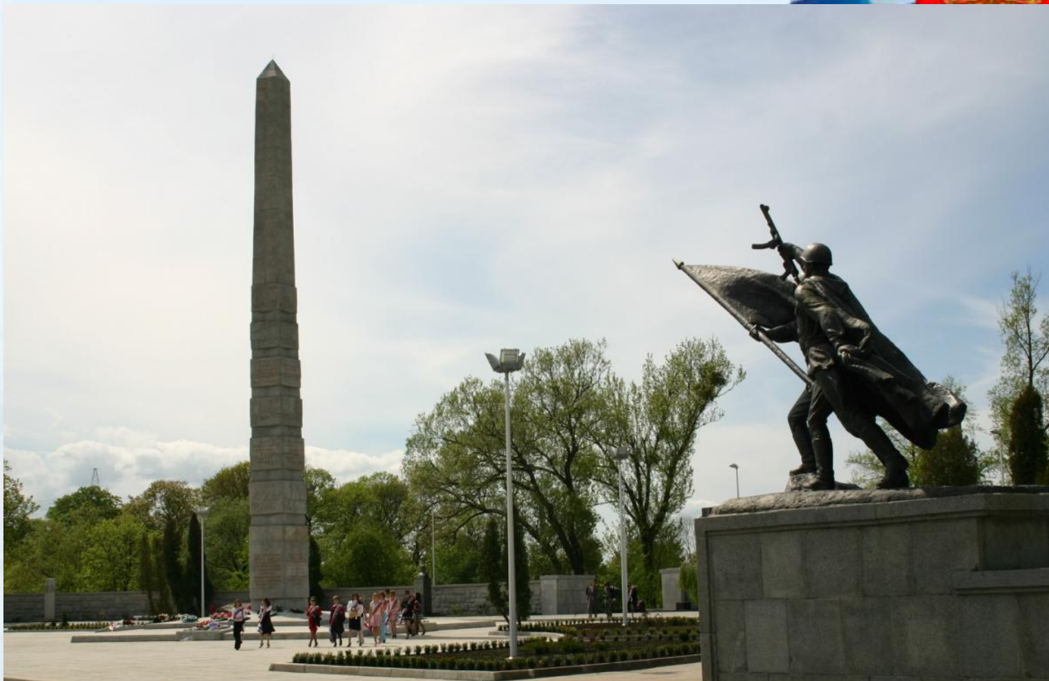
Памятник 1200 воинам-гвардейцам, погибшим при штурме Кёнигсберга