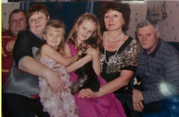
Это мои бабушки и дедушки у мамы на днях рождения