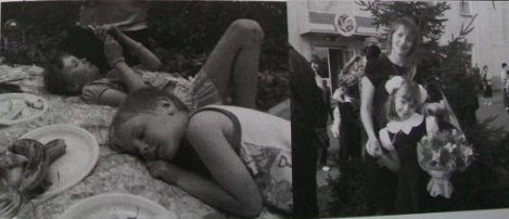
мы и конечно жепослушные школьницы