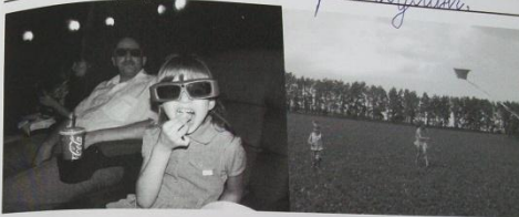
прощание с летними отпуском на природе