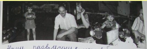
Наши развлекательные игры в школе