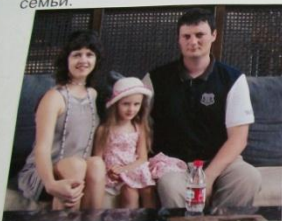
Это мои родители в Китае

На этих страницах представьте фоторассказ о жизни своей семьи. Постарайтесь в фотографиях и подписях выразить своё отношение к близким людям, к событиям в жизни семьи.