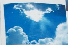
ЭТО ВСЕ МОЁ, РОДНОЕ!