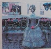
Памятник «Лобань» (первая жена губернатора Т. С. Гаврилова)