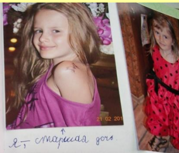
это старшая дочь