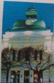
Главная куранта Омска