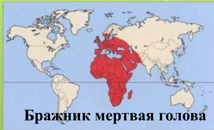
Бражник мертвая голова