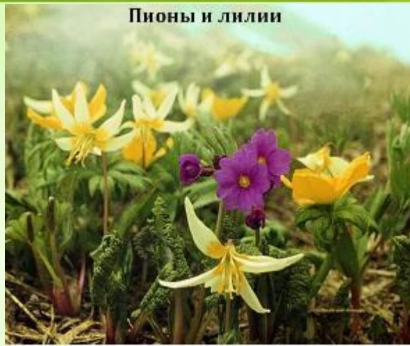
Пионы и лилии