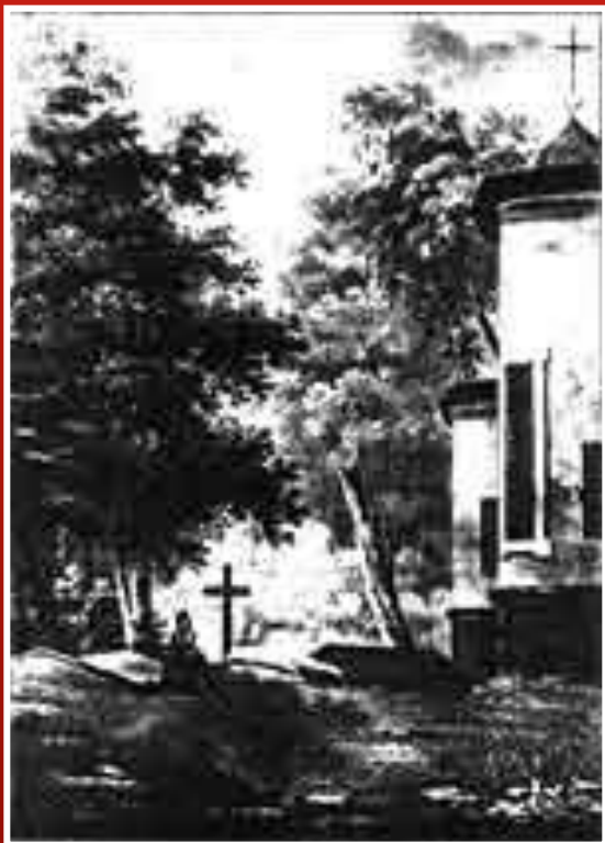
Могила А. С. Пушкина после смерти поэта