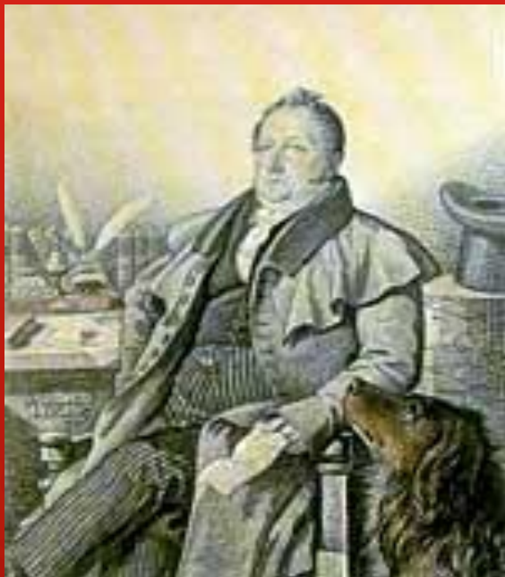
Отец, Сергей Львович Пушкин (1770-1838г.)