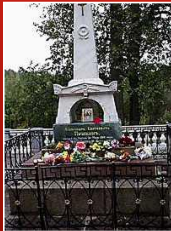
Могила А. С. Пушкина в наше время