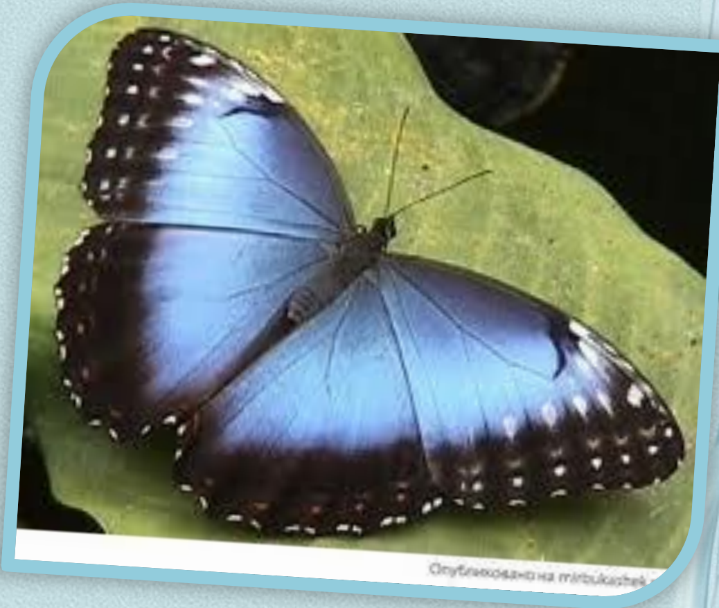
Спугльковик на тлі Букашні