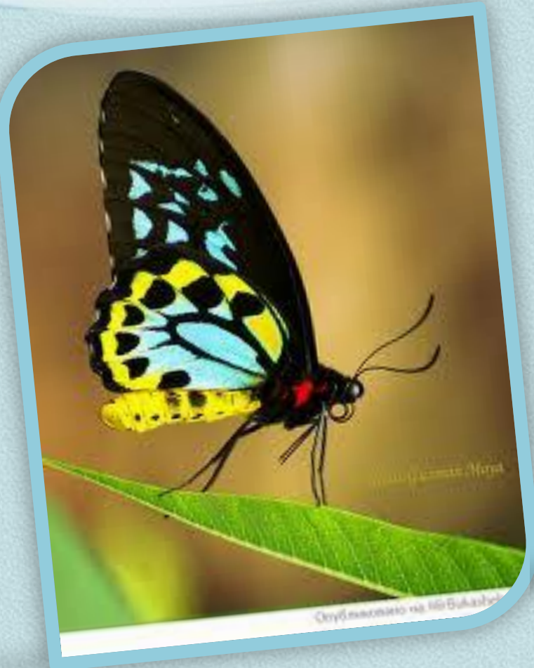
Спугльковик на лілі Букашкі