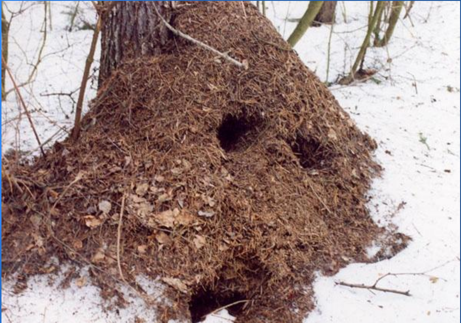
Работа дятла желна.