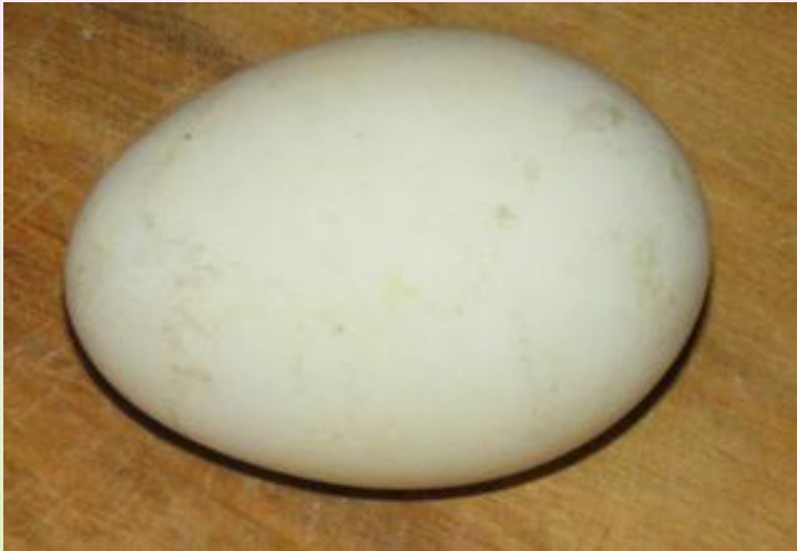
Это гусиное яйцо.