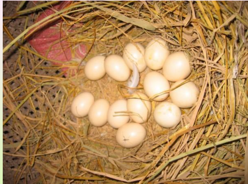
Это гусиные яйца.