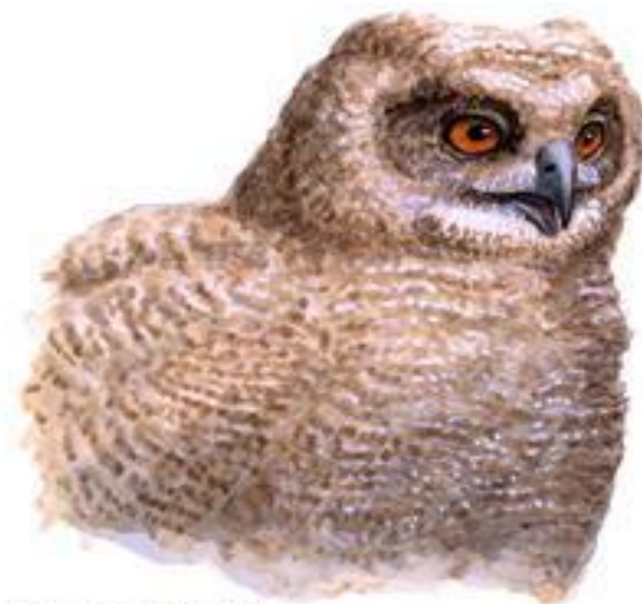
птенец в мезоптиле