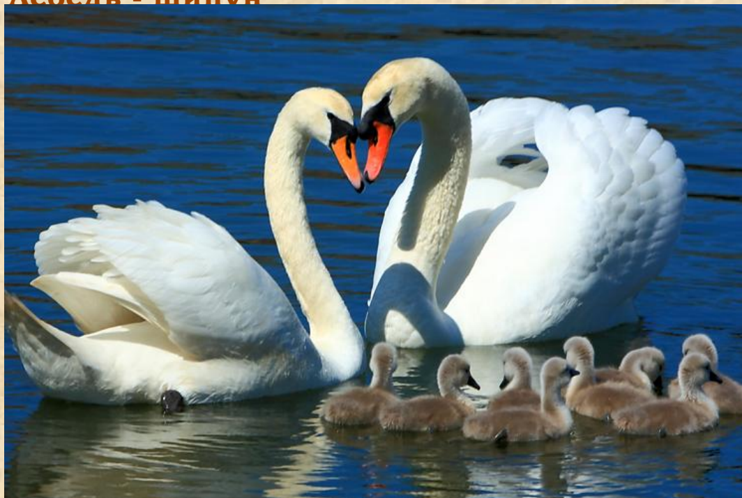
Лебедь - шипун