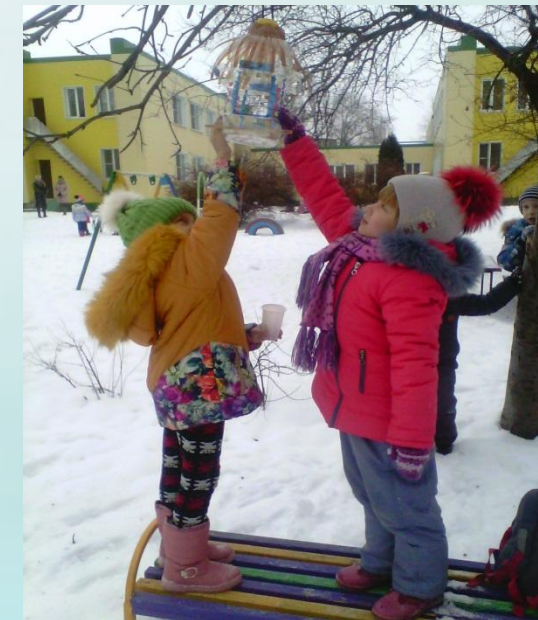
Насыпаем корм в кормушки