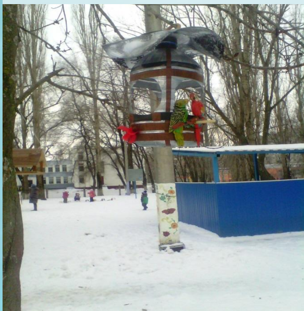
Наблюдение за птицами