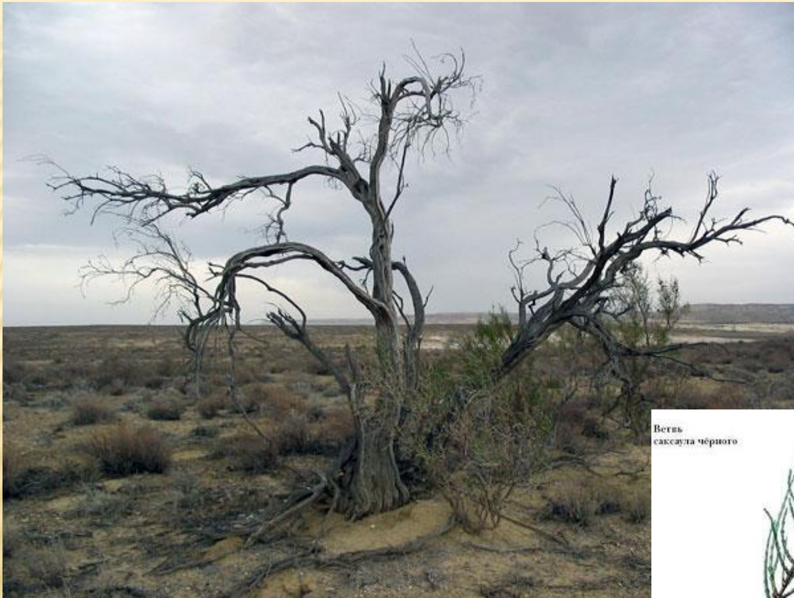
Ветвь саксаула чёрного