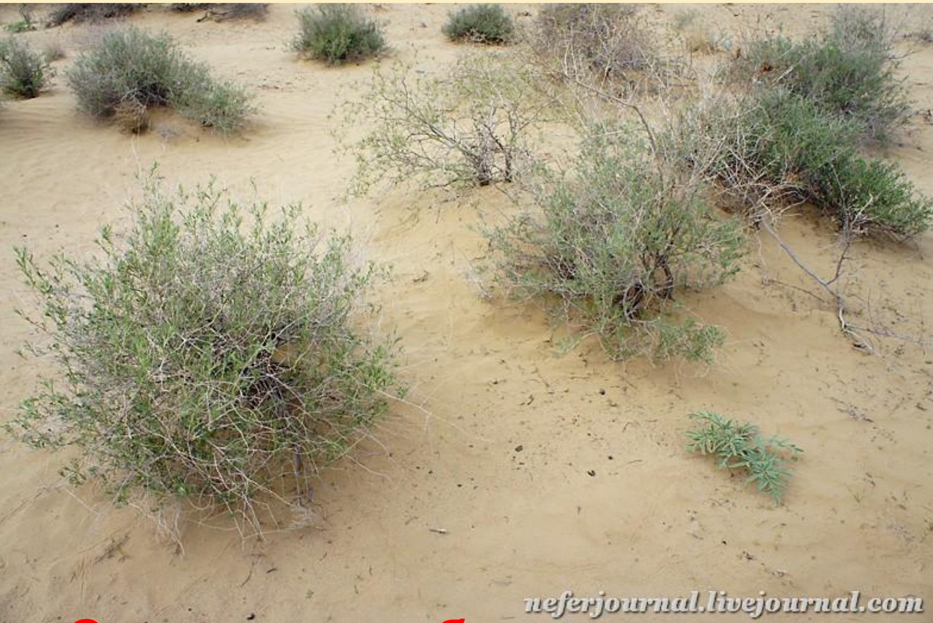
Саксаул и верблюжья колючка