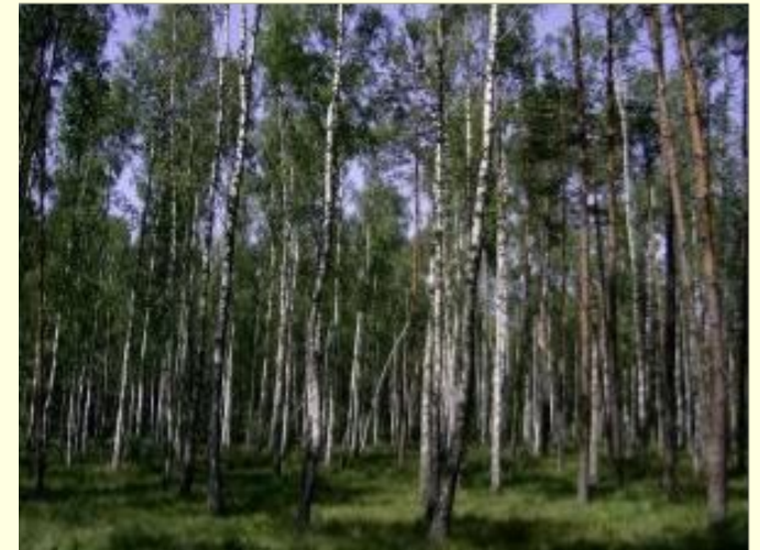
Леса на равнинах