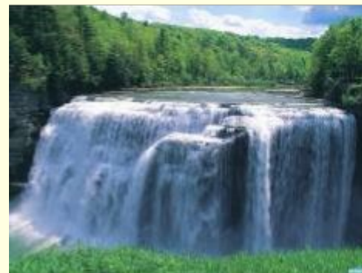
Водопады в холмистой местности