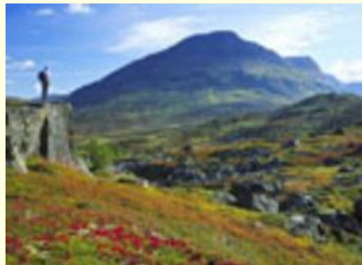
Реки и горы Швеции